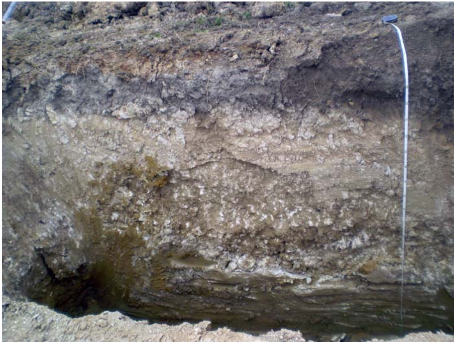
Lám. 3. Perfil Norte de la pequeña cata realizada donde se puede ver el tipo de margas descrito.

Estos resultados coinciden con los de la intervención arqueológica.