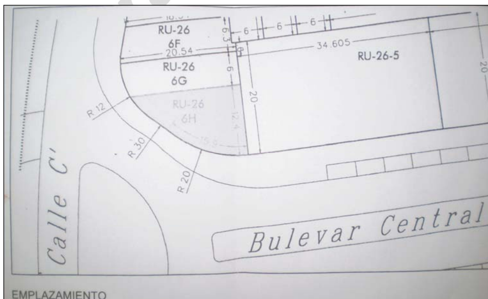
Fig. 2 Emplazamiento del solar.

Tiene forma rectangular con uno de sus lados achaflanado ya que se encuentra en la esquina SW de la manzana.