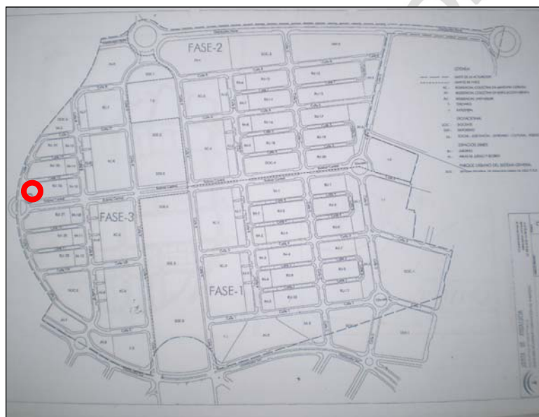
Fig. 1 Plano de situación del solar

El solar se sitúa en la parcela RU 26-6H de la 3ª fase del SUNP 1 de la Zona Arqueológica de Marroquíes Bajos de Jaén, al exterior del V foso de la macro-aldea prehistórica de Marroquíes Bajos.