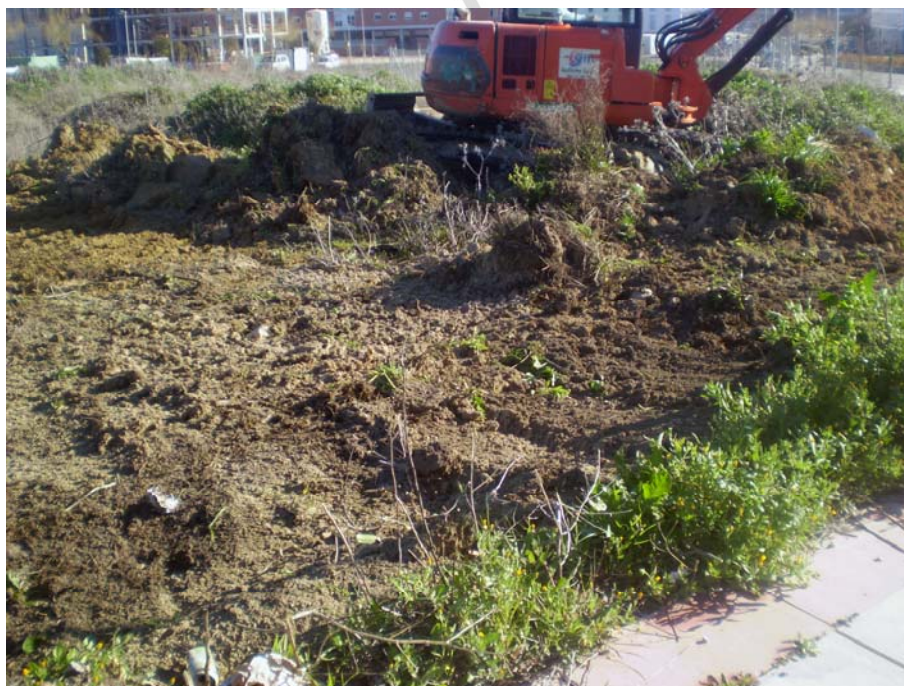
Lám. 1 Limpieza mecánica de la cubierta vegetal

La máquina empleada para los movimientos de tierra es una "Takeuchi modelo TB175" con cazo de limpieza.