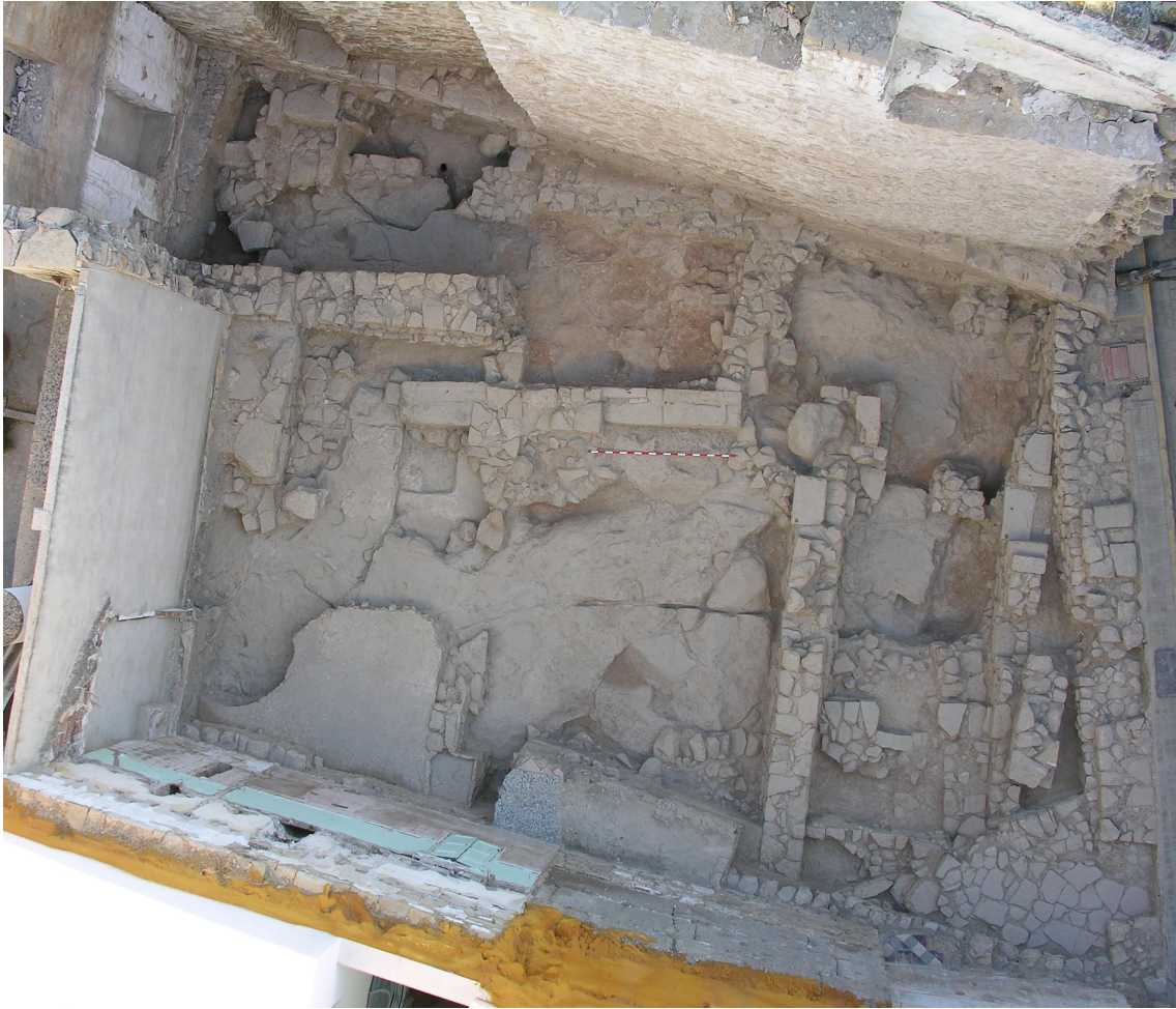
Fig. 1. Vista final de la intervención en el solar nº 15 de la calle Juan de Mata Dacosta.

Fototeca ARQVIPO, sign. FD-2010-07-20-013. Año 2010.