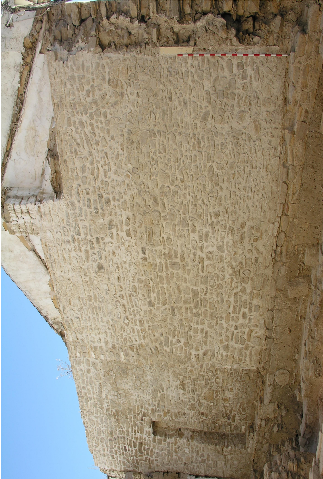
Fig. 2. Vista desde el NE del tramo de la Muralla de la Villa que discurre por el solar nº 15 de la calle Juan de Mata Dacosta tras la restauración de la misma.

sign. FD-2010-07-26-126. Año 2010.