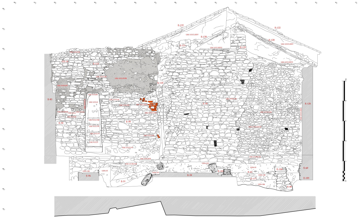
Lámina II. Vista de la Muralla de la Villa tras la excavación del solar.