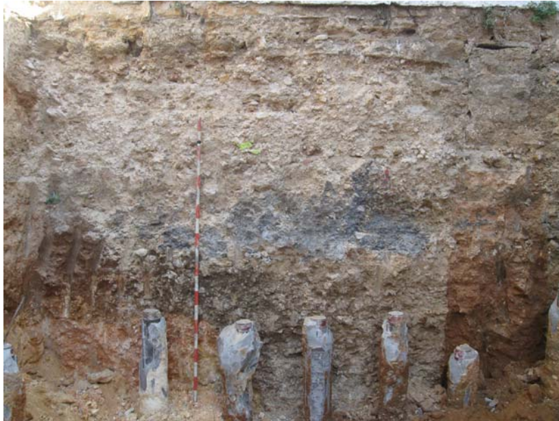
Figura 2. Corte 1.