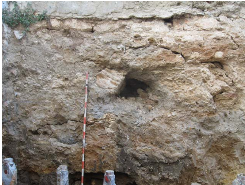
Figura 3. Corte 2.