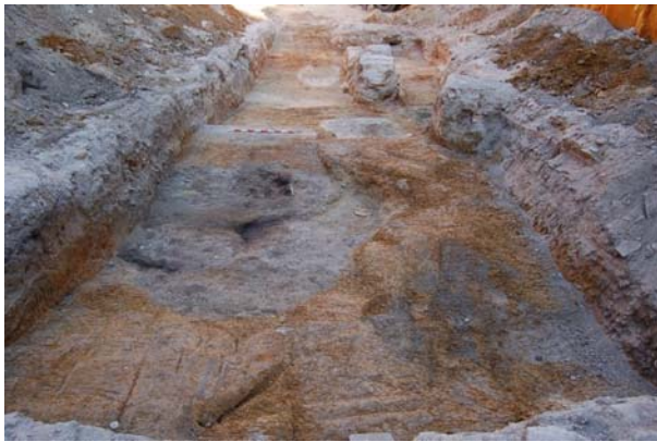
Figura 1. El solar durante los trabajos de Control Arqueológico de Movimiento de Tierras