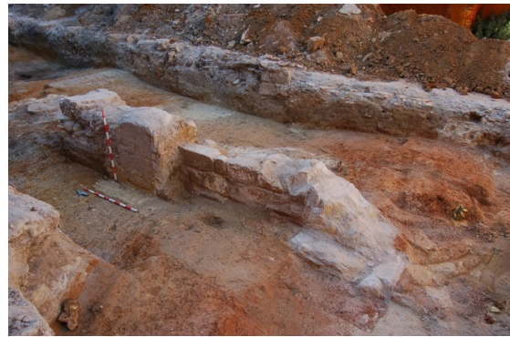
Figura 3. UEEE 14, 18 y 29.