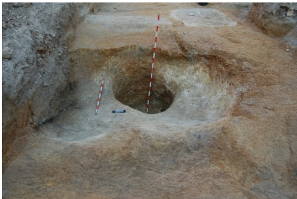
Figura 2. UUEE 07 y UE 30