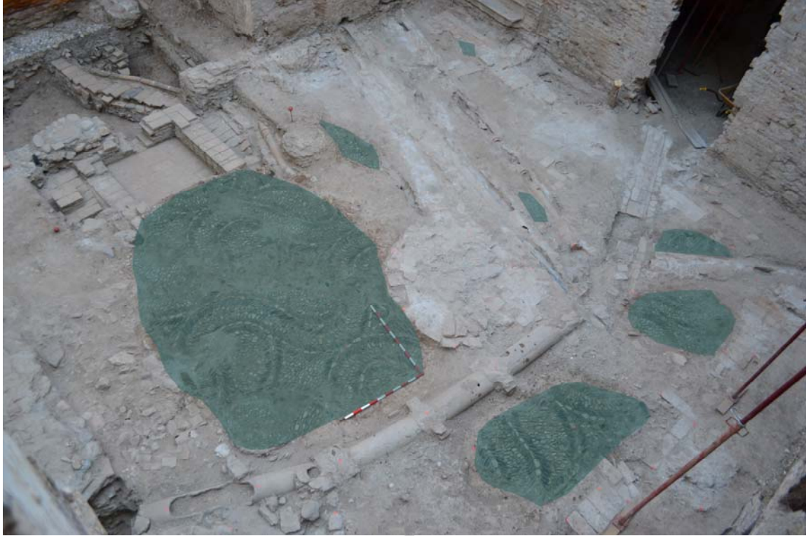
FIG.1. Planta de época musulmana.