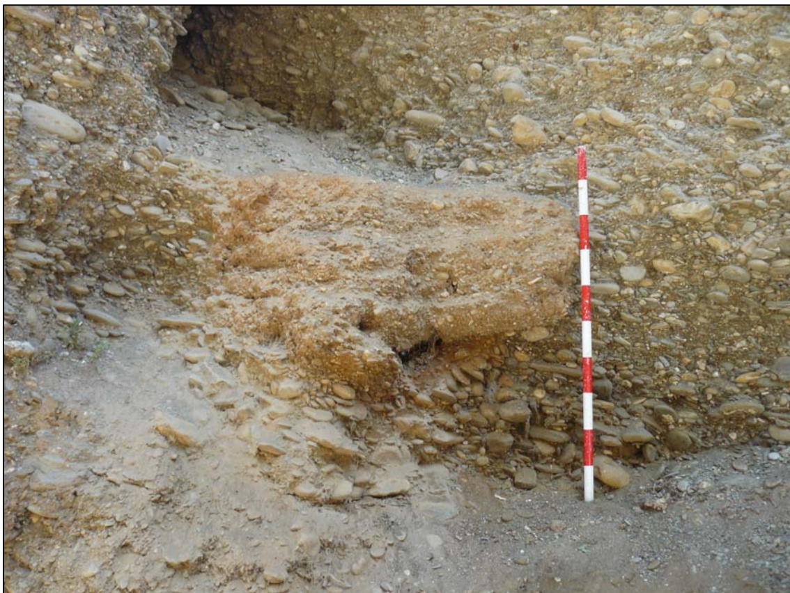
Imagen: Vista de los posibles restos muy deteriorados de un muro de tapial.

fragmentos de cascotes contemporáneos así como algunos materiales como plásticos y basuras varias. Este nivel apoya directamente sobre el murete de mampostería contemporáneo que actualmente separa el camino empedrado de los taludes del Generalife. Este nivel, de unos 0,30 m de ancho, aparece en todo el recorrido de la zanja y está asociado a la construcción del murete de mampostería con mortero de cemento. Este nivel corta directamente al Conglomerado Alhambra, que en la falda de los taludes aparece cubierto por los niveles UE-001 y 002.