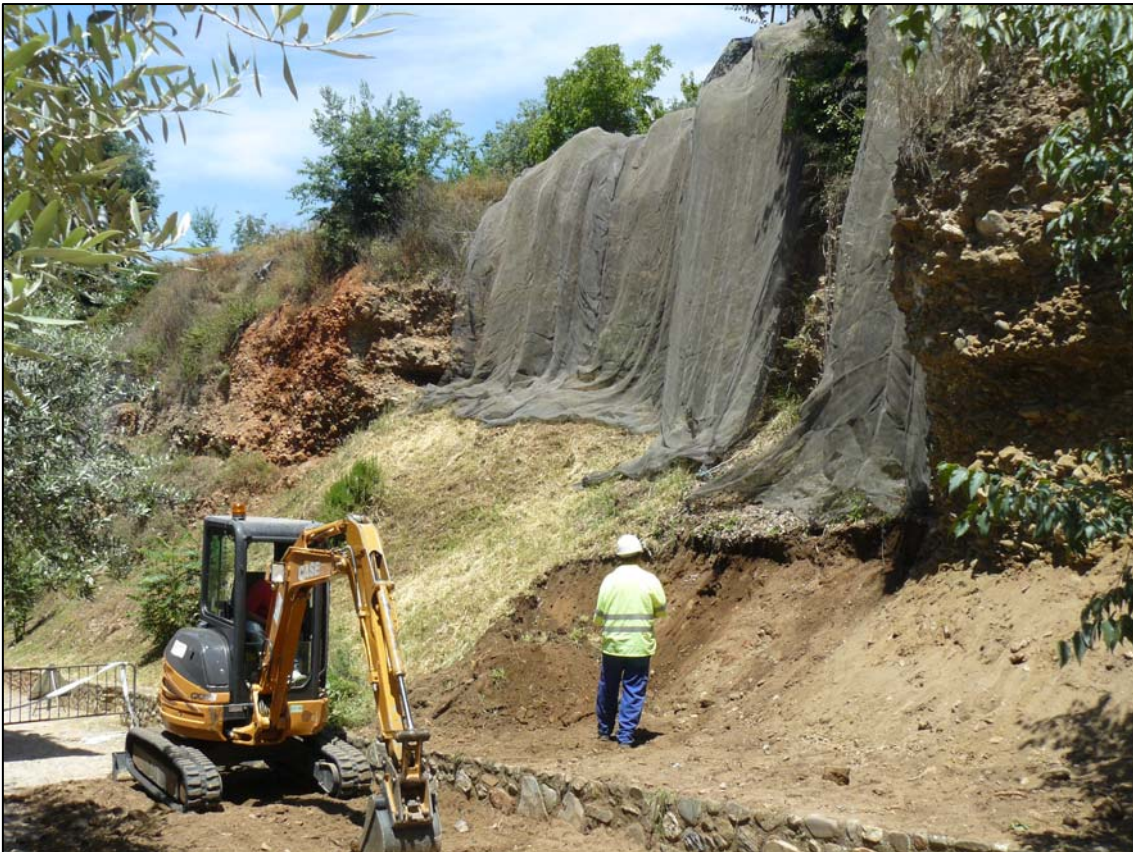
Imagen: Una vez hecha la zanja junto al muro de mampostería y limpio el talud del nivel de derrubios se colocan las mallas de protección.