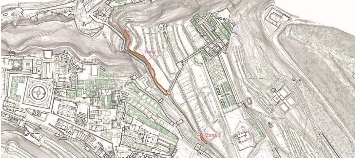
Localización de los dos ámbitos de actuación. Zona 1 y 2