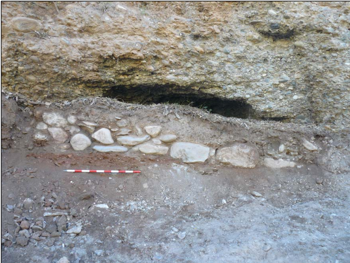
Vista del muro UE-003 durante los trabajos de limpieza manual del talud.

directamente sobre el talud, es decir, está fabricado a fondo perdido. Parece responder a un muro de contención de las gravas, apoya directamente sobre un relleno de tierra compacta de color rojizo mezclada con cascotes contemporáneos bastante fragmentados, esta capa de 0,20 m de espesor es la UE-004 . El murete se ha conservado.