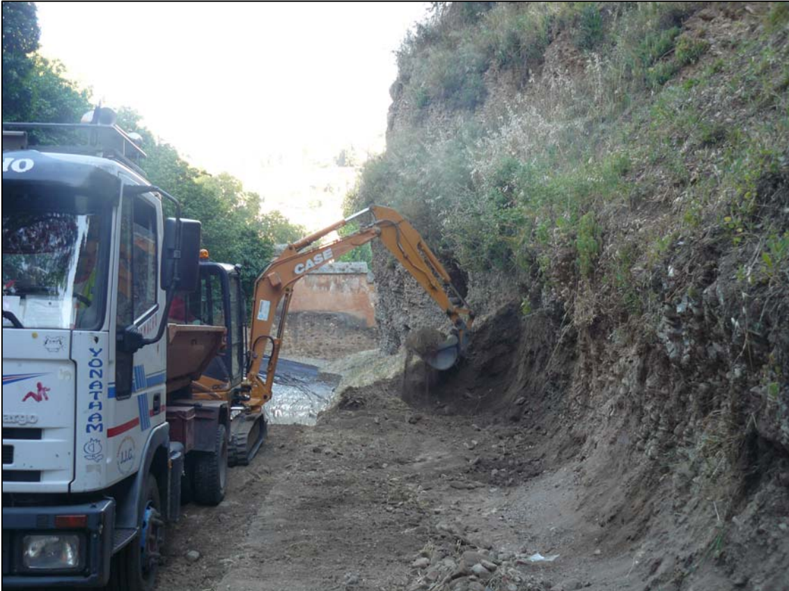
Imagen: Limpieza de taludes, se observa la gruesa capa de derrubios UE-001.