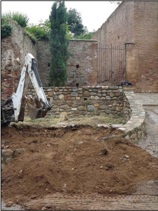
Imagen: Vista del inicio de los trabajos, retirando la UE-001.

Bajo el nivel superficial se documentó la UE-002 : una capa de tierra suelta de tonalidad anaranjada, mezclada con piedras pequeñas y algo de grava, así como con intrusiones de materiales contemporáneos, tales como fragmentos de plástico y cascotes. Esta capa se apoyaba en el murete de mampostería levantado en las últimas obras de adecuación del Cuesta del Rey Chico, realizadas a inicios del presente siglo XXI.