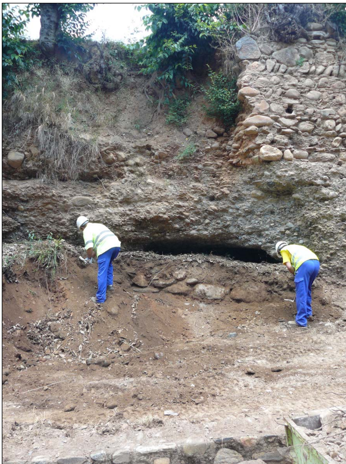
Imagen: Detalle de la limpieza manual del talud en la Zona I en el momento que se documenta el muro UE-003. Posiblemente relacionado con una reparación del muro superior así como con una actuación para contener la