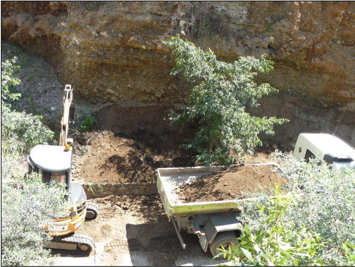
Imagen: Desarrollo de los trabajos, Vista desde la Torre de los Picos.

bolsada de grava en el Conglomerado Alhambra.