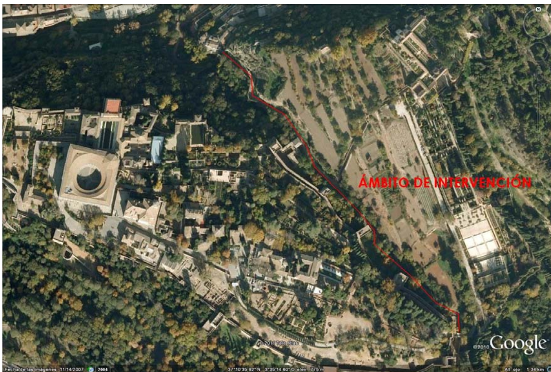
Vista general de la zona de intervención

La intervención arqueológica se localizó en el recinto del Patronato de la Alhambra y el Generalife, concretamente en uno de los caminos de acceso al monumento, la Cuesta del Rey Chico, popularmente conocida como de los