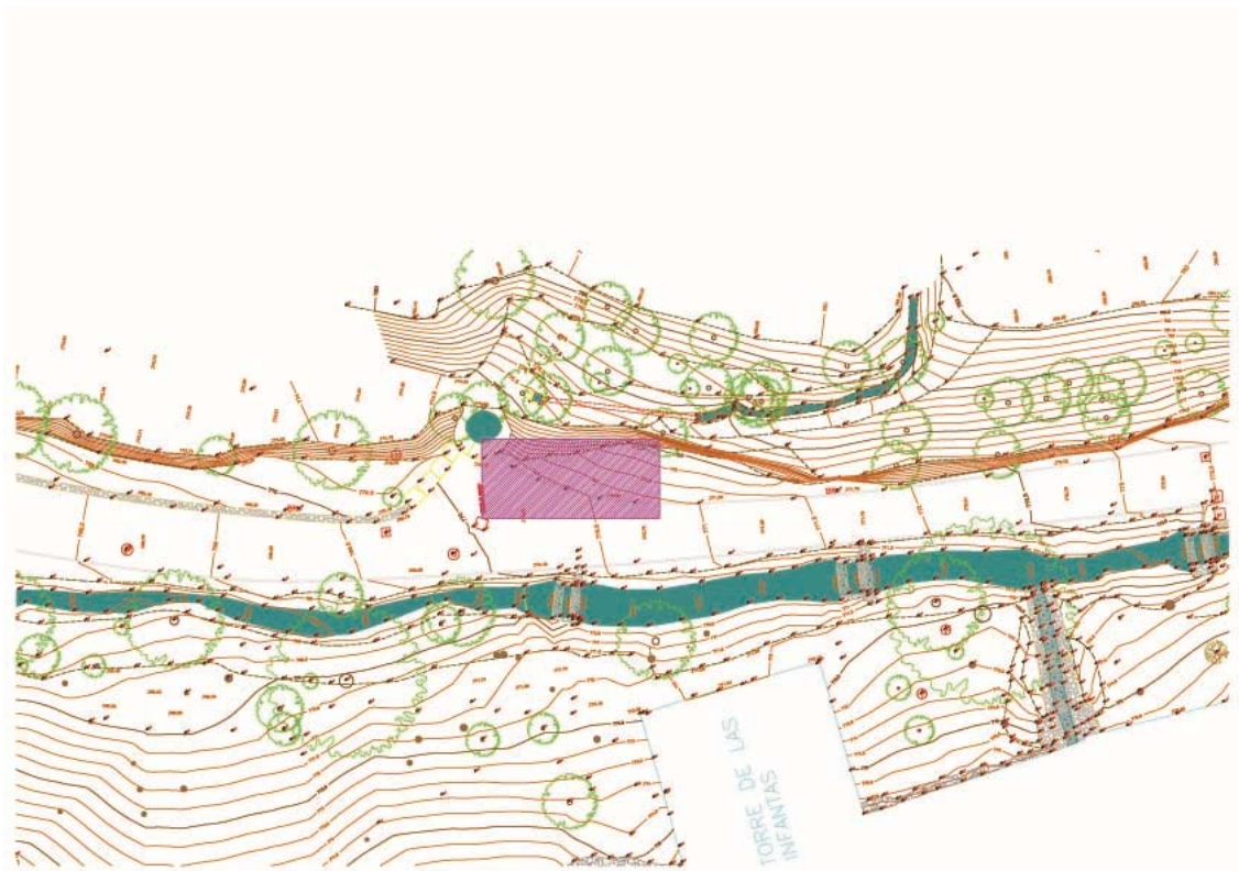
Localización de la Zona 1