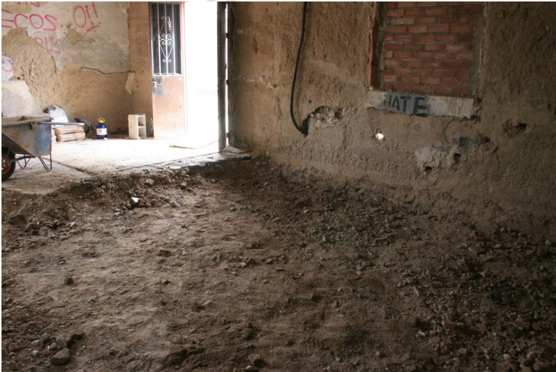
Vista del área en cuestión tras el rebaje proyectado.