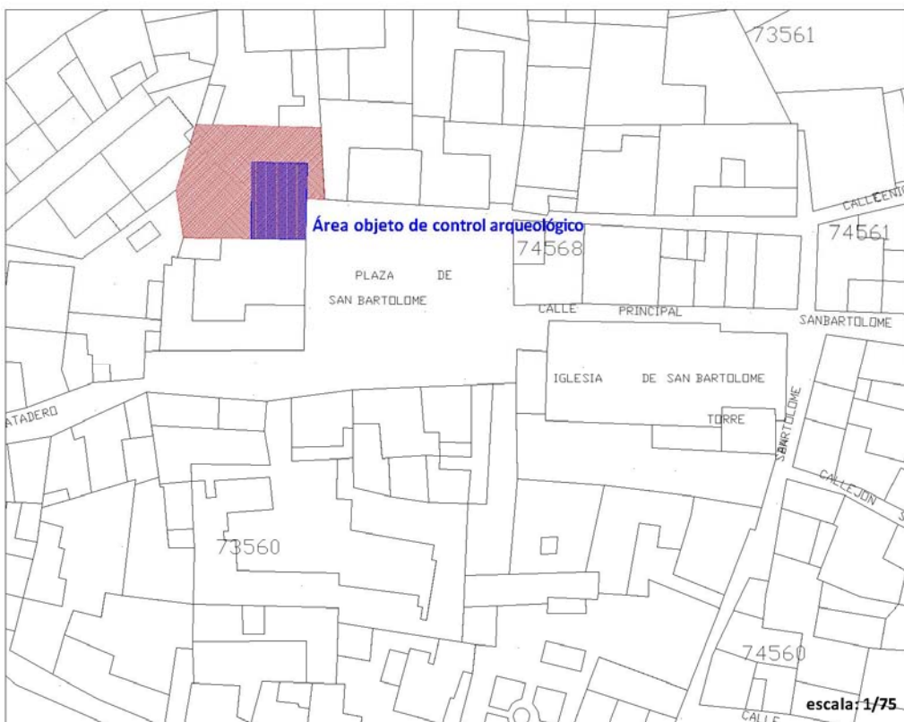
Planta del solar y área afectada.