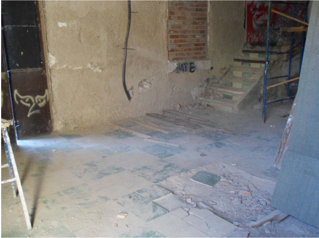
Vista de la zona objeto de vigilancia arqueológica antes de la intervención.