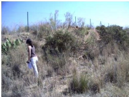
Fotografía 26. Zona préstamos 4.