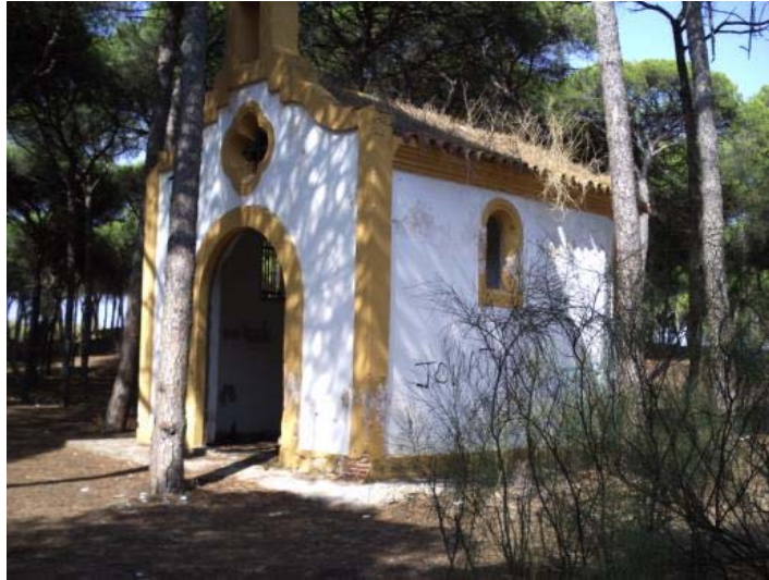
Fotografía 13. Hernita en zona 4.