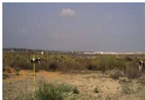
Fotografías 9 y 10. Zona 3. Espacio vallado con ganado al norte de la carretera y detalle.