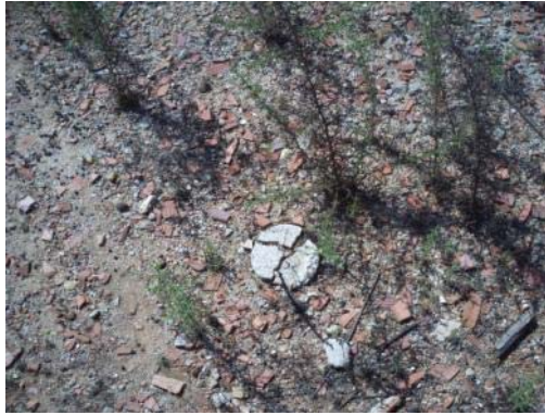
Fotografía 23. Zona de préstamos 3. Detalle del basurero.