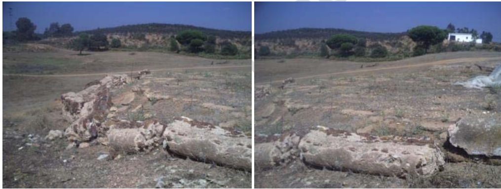
Fotografías 16 y 17. Detalle de la era en zona de préstamos 1.