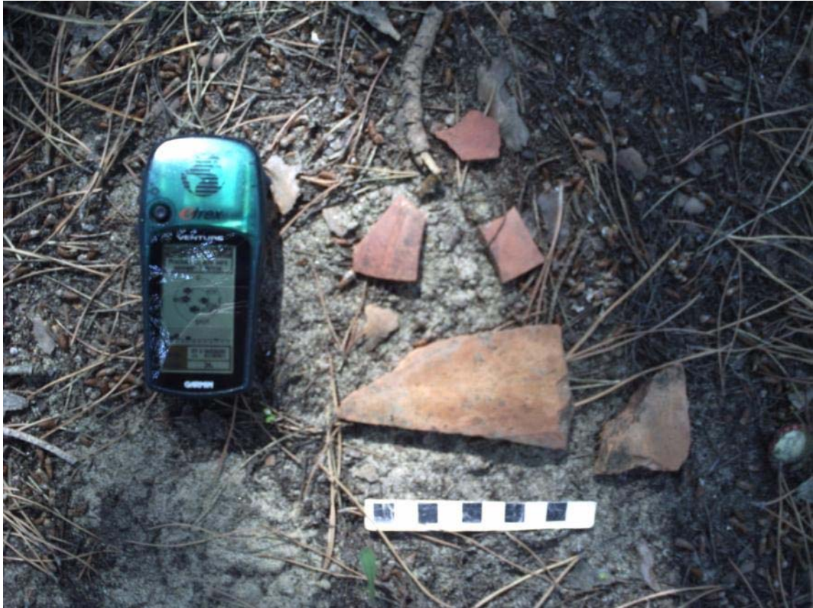
Fotografía 5. Material romano. Detalle.