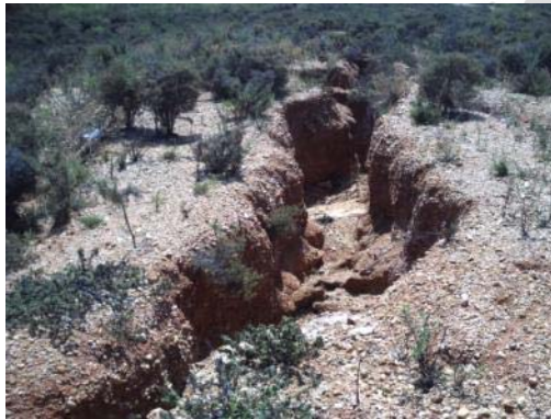
Fotografía 24. Zona de préstamos 3. Detalle.