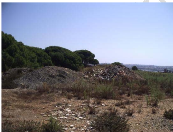
Fotografía 21. Zona de préstamos 3. Basurero.