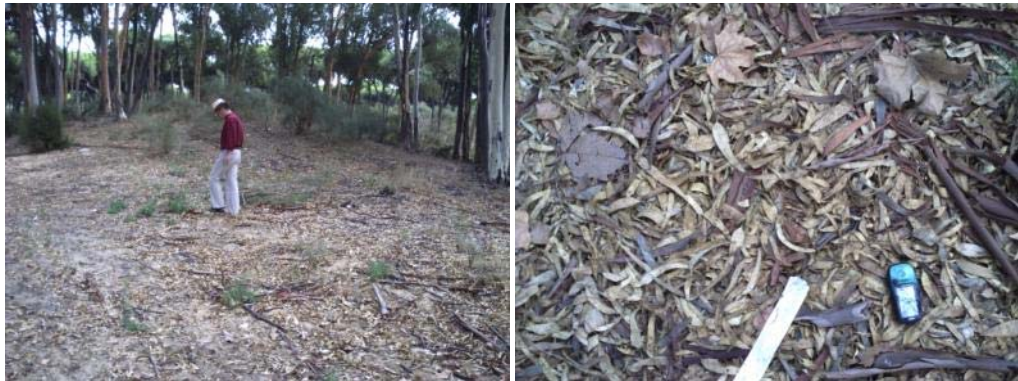
Fotografías 1 y 2. Zona 1., al sur de la carretera y detalle.