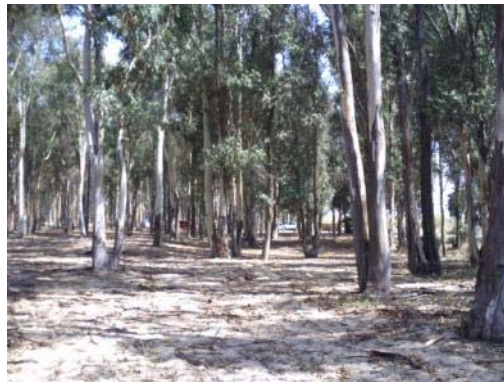
Fotografía 4. Zona de localización del material romano.