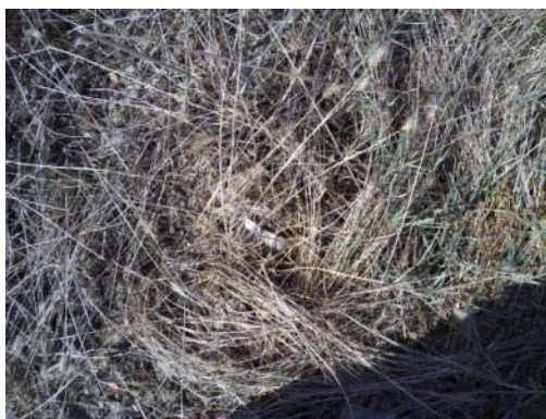
Fotografía 8. Zona 2. Detalle.