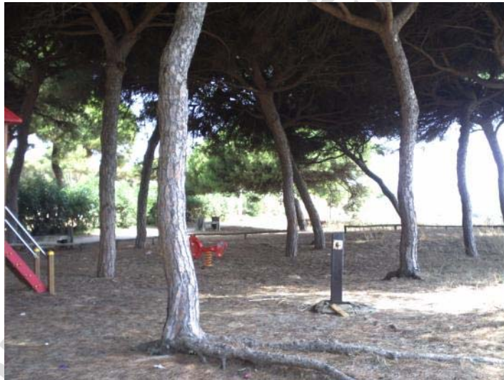
Fotografía 3. Parque infantil. Al sur de la carretera.