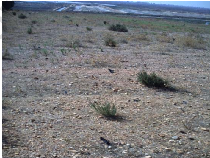
Fotografía 18. Zona de préstamos 2.