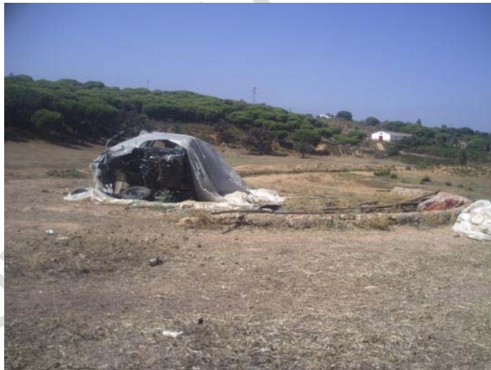
Fotografía 14. Era en zona de préstamos 1.