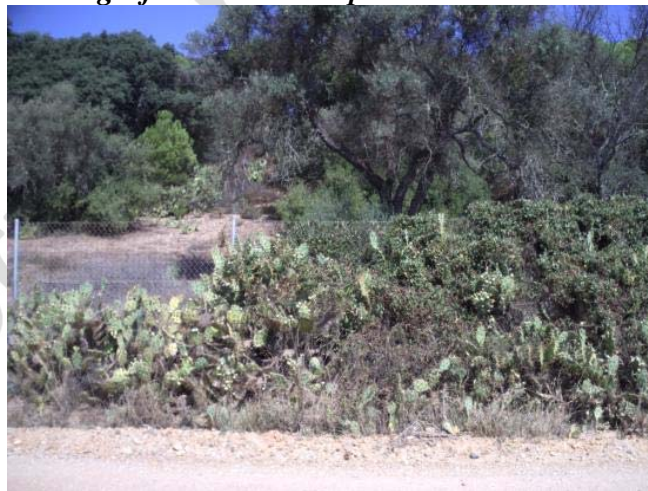
Fotografía 25. Zona préstamos 4.