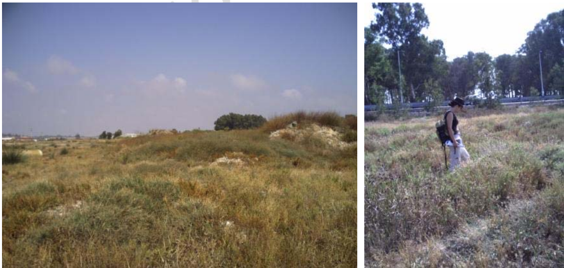
Fotografías 6 y 7. Zona 2. Al norte de la carretera.