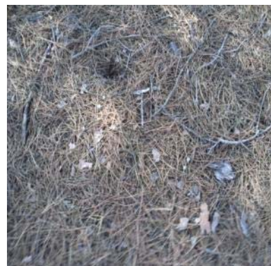
Fotografías 11 y 12. Zona 4. Al norte de la carretera y detalle.