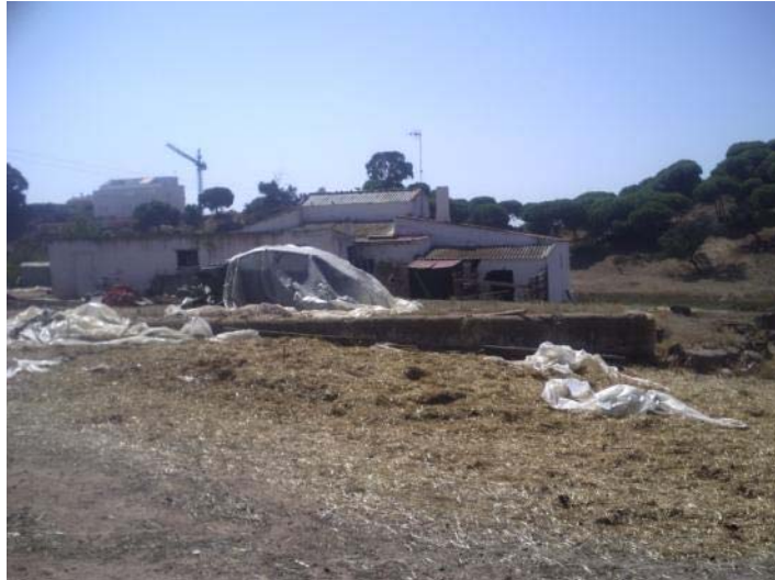
Fotografía 15. Era en zona de préstamos 1.