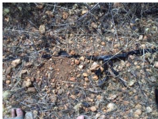
Fotografías 19 y 20. Zona de préstamos 2. Detalle del cultivo en plásticos.