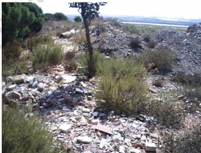
Fotografía 22. Zona de préstamos 3. Basurero.