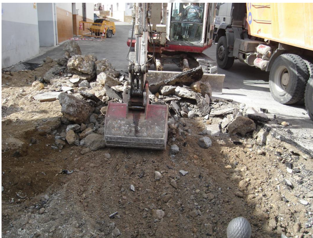
Lámina 1: proceso de desmonte de U.E.C 1 y U.E.C 2

Tras la retirada de Tras la retirada del asfalto y encerado, perteneciente a la primera década del actual siglo, ha sido retirada una gruesa capa de hormigón destinada a dar robustez y nivelación de las mencionadas. Bajo esta capa de hormigonado, sólo ha sido documentado un nivel de relleno compuesto mayoritariamente por arena, gravilla y pequeñas piedras, cuya datación también corresponde a época contemporánea. Todas estas unidades estratigráficas tienen su origen en una obra acontecida apenas hace unos años con motivo de canalizar un nuevo saneamiento y abastecimiento de aguas en las calles Mesa y Ancha.