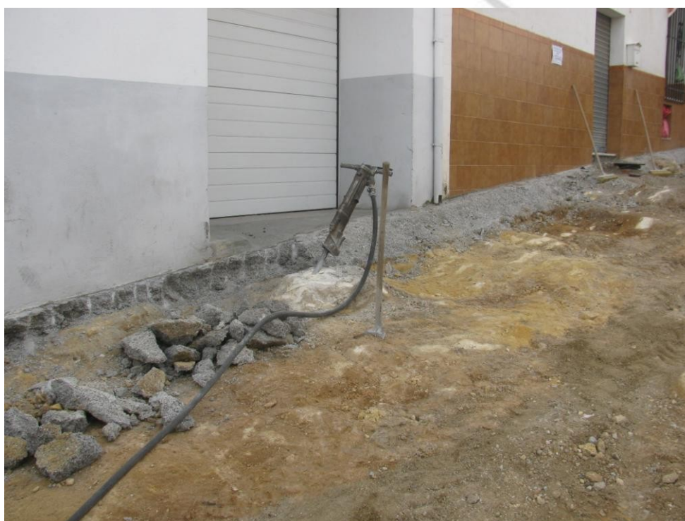
Lámina 2: Afloramiento del sustrato geológico U.E.S 2

Sólo ha podido ser documentada una fase constructiva. Todas las estructuras y sedimentos hallados durante el transcurso de la intervención datan de la primera década del siglo XXI, momento en el que fueron renovadas la red de saneamiento, con sustitución de las redes de hormigón machihembrado por U-PVC, la renovación de la red de agua potable, acometidas, bocas de riego e incendios de la antigua red, y pavimentado de las calles con firme rígido de hormigón y acerado con losas graníticas.