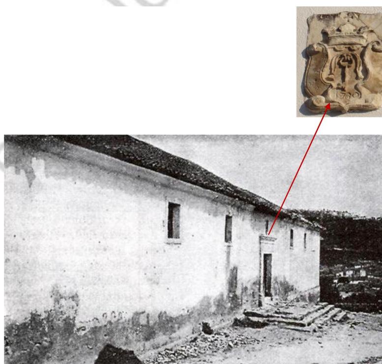
Figura 2: Antiguo Pósito, situado en C/ Mesa y escudo del Pósito aún conservado en el nuevo inmueble de Bodegas López

El Pósito Nuevo, situado en calle Mesa, fue derribado en los años 40 del predecesor siglo. En la actualidad, el lugar que ocupaba el antiguo Pósito se encuentra ocupado por las Bodegas López. Sin embargo se sigue conservando en la fachada del nuevo inmueble el escudo original del viejo inmueble donde se puede observar la fecha de construcción del antiguo edificio (1769).