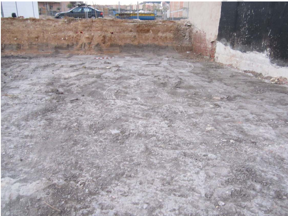
Figura 2: Tierra de cultivo (US 2)

La existencia de los recursos hídricos como el arroyo del Molinillo localizado en las cercanías de nuestro solar, ha favorecido la explotación agraria de esta zona.