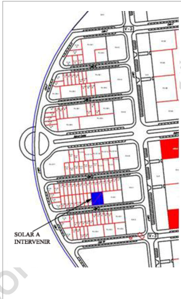
Lámina 1: localización del solar objeto de intervención

La superficie total afectada por el proyecto de edificación, suma un total de 360,38 m 2 . Linda al Norte con la fincas RU-22-2F, RU-22-2G, RU-22-2H, al Sur con la calle pintor José María Tamayo donde tendrá fachada el futuro inmueble, al Este con la finca RU-22-1, al Oeste con la finca RU-22-2Q.