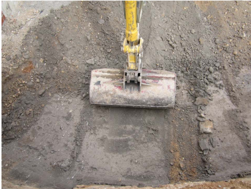
Figura 1: Proceso de desmonte de US 2 (tierra de cultivo)

El primer paso, ha consistido en documentar fotográficamente el estado en que se encontraba el solar antes de comenzar la control arqueológico. Seguidamente se ha documentado de manera gradual, el proceso de desmonte de los niveles estratigráficos de solar. El ritmo y los medios utilizados para la extracción de tierra (cazo de limpieza de 1,1 m. de longitud) han permitido la correcta supervisión del Control de Movimiento de Tierras.