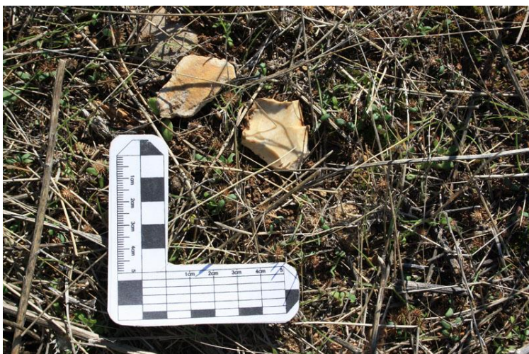
Foto 6: detalle de material lítico localizado en superficie en Llano los Mazuelos

Hay que destacar la presencia de restos de material lítico prehistórico en toda la superficie de la zona intervenida, sin encontrarse éstos en los estratos más profundos. Se trata de lascas y algunos núcleos de sílex (de los que se han recogido algunas muestras) que, en un análisis preliminar, pueden adscribirse al periodo paleolítico. Algunos de los fragmentos presentan un alto grado de redondeamiento, lo que indica que han sido sometidos a transporte por determinados procesos geológicos.