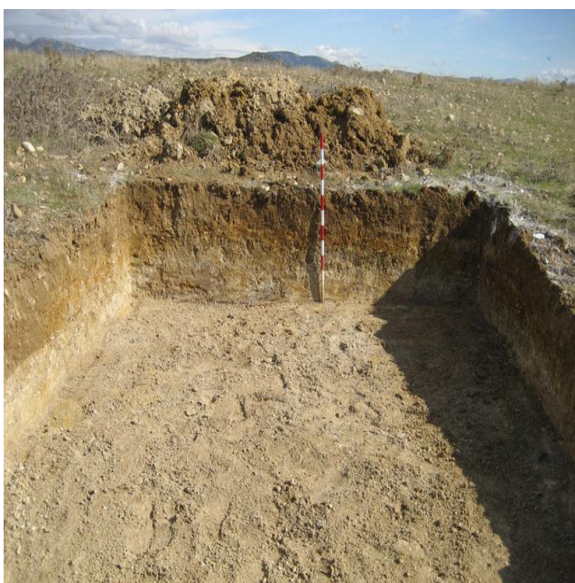
Foto 5: uno de los sondeos ya finalizado donde se observan los niveles geológicos

Con la finalidad de asegurar la inexistencia de restos de carácter arqueológico relacionados con la villae romana localizada en la prospección, se plantearon dos catas de 3mx5m cada una. En éstas el resultado fue igualmente negativo en cuanto a posibles estructuras o material asociado a la villae.