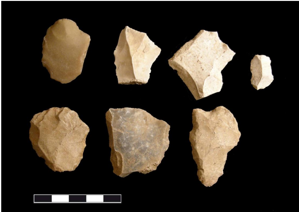
Fotos 7: detalle de algunas lascas de sílex encontradas en superficie

En el área de Alcalá la Real se han documentado varios yacimientos al aire libre pertenecientes al periodo Paleolítico Medio. Ejemplo de ello son los yacimientos de Llanos de Santa Ana y Ermita Nueva (Borrás et al. , 2004), que nos permiten hablar de “industria lítica del Complejo tecnológico del Paleolítico Medio”. Se trata de asentamientos temporales caracterizados por