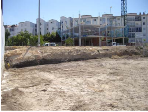
Fig. 2. Finalización de la Intervención.