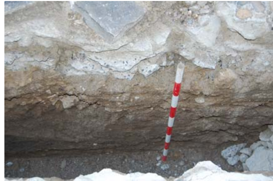
*Calle de los Claveles.