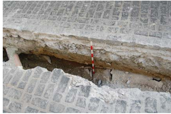
*Cuesta de los Rojas.