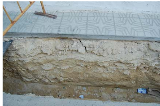
*Calle Cristo de los Avisos.