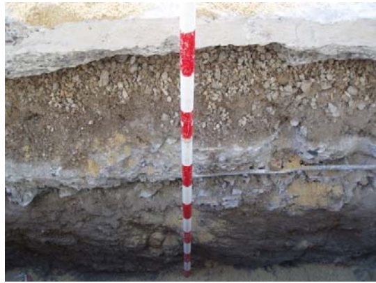
*Plaza Fernández Viagas-Cristo de los Avisos.