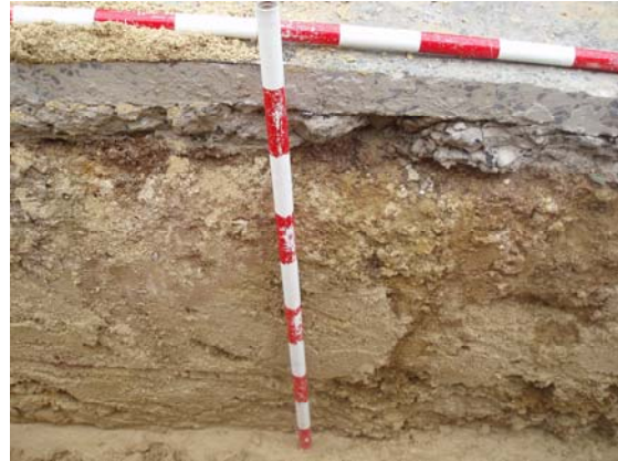
*Urbanización Santa Catalina IV.