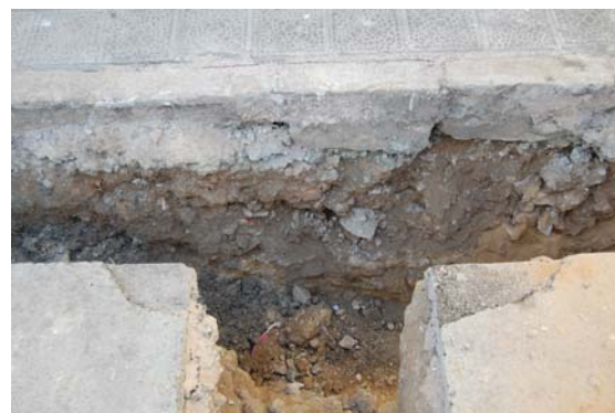
*Avenida de la Legión.