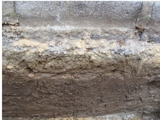
*Callejón de los Urbina.