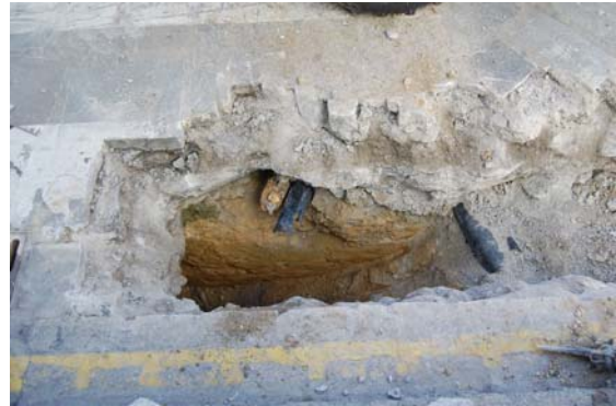
*Urbanización Santa Catalina I.