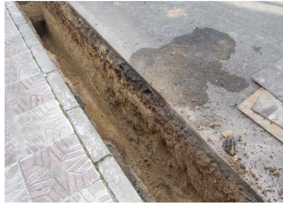
*Urbanización Nueva Andalucía II.