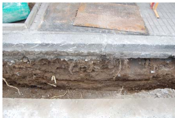
*Avenida Infante Don Fernando.