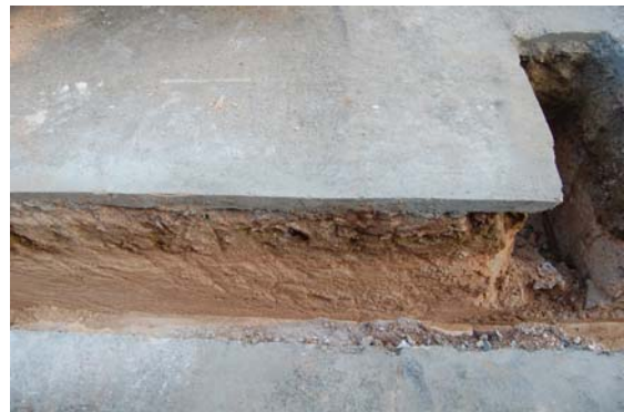
*Urbanización Santa Catalina II.