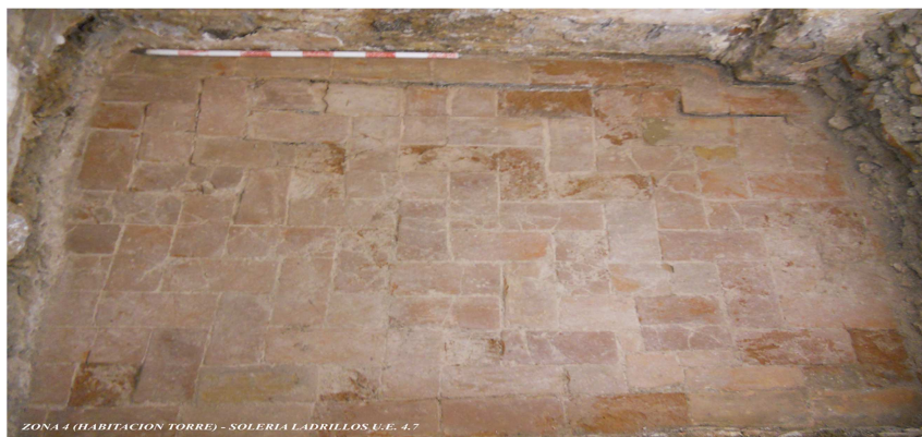
ZONA 4 (HABITACION TORRE) - SOLERIA LADRILLOS U.E. 4.7

En ella el rebaje ha sido de escasa incidencia, no contemplándose más que una sucesión de pavimentos superpuestos directamente, sin rellenos terrígenos o con escasas camas de asiento según el caso. En este sentido se documentó fotográficamente esta sucesión de pavimentos que aquí relacionamos: