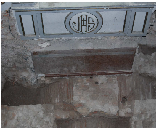
Imagen cenito-frontal de los resultados en la capilla. Abajo imagen con el frente de altar recuperado tras la mesa anterior.

Estas actuaciones se han visto reflejadas y paliadas en la intervención con algunos detalles como la recuperación del frente de altar de mármol original de la capilla.