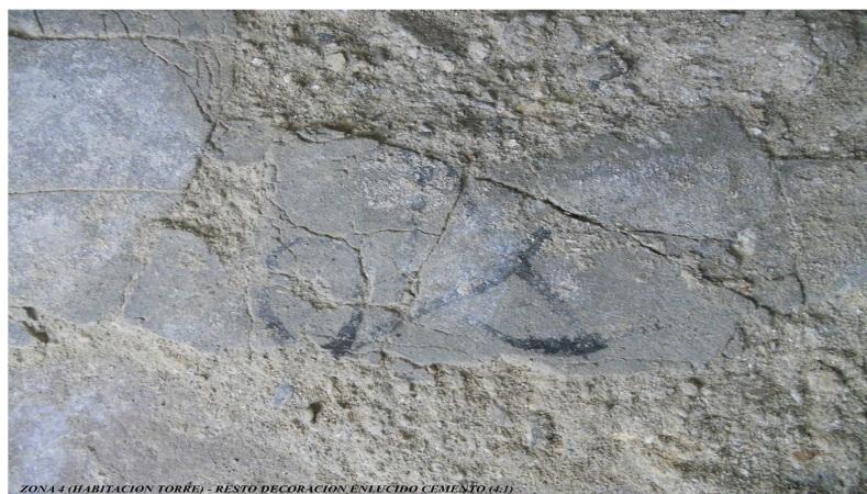
ZONA 4 (HABITACION TORRE) - RESTO DECORACION ENLUCIDO CEMENTO (4.1)

Por encima volvemos a levantar nuevos pisos, en este caso simples lechadas de cemento pulido de ínfimo grosor. La búsqueda de cierta prestancia se aprecia en los restos cromáticos que presentan; burdeos en el suelo inferior (Ue. 4.2) y curiosos trazos negros de lacería, sobre enlucido albo, el superior (Ue. 4.1).