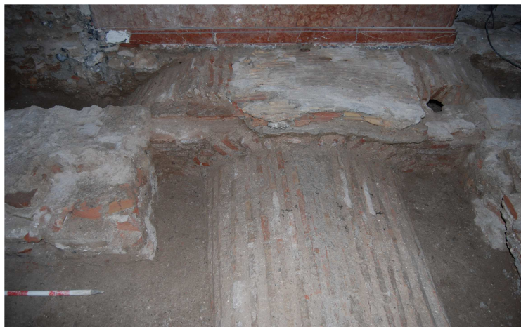
Imagen de la bóveda del pasillo de acceso a la cámara funeraria y arranque de la misma reparada con rasillas y cemento.

Para igualar el terreno a fin de solventar la nueva ubicación del zócalo y mesa del altar, se debió rebajar hasta llegar a afectar a la bóveda, “rasurando” la parte superior de la misma y provocándole incluso una tronera en la parte central. Al reparar la rotura se oblitera mediante rasillas simples (adelgazadas para no superar la cota) ligadas con cementos (Ue. 1.6).