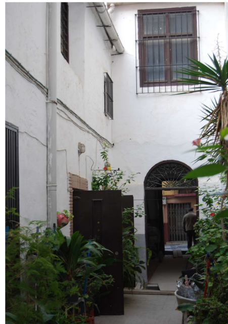
Imagen del callejón lateral a la Iglesia por donde se accede a las salas anexas. Se ha considerado como un vestigio del trazado de la muralla musulmana.

De esta manera, como se ha señalado, hemos podido acercarnos a momentos post-fundacionales de la Iglesia y marcar la existencia de una construcción entre la misma edificación religiosa y la primitiva torre campanario. La presencia del pozo (Ue. 3.3) y de las estructuras anexas al mismo nos señala como de alguna forma ambos elementos se hallaban ceñidos por construcciones adjuntas. Entendemos que este mismo elemento nos determina que se caracterice como un hábitat de carácter doméstico por lo que podemos considerar que se trate de la vivienda de los campaneros, hecho recurrente en los templos de cierta envergadura.