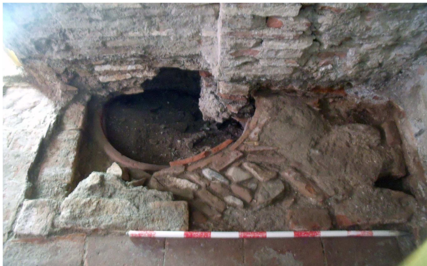
Detalle de pozo, pavimento y espacios anexos.

La infraestructura se encontraba finamente rematada, ajustada en el suelo mediante ladrillos que seguían su forma circular y enmarcada por un cuadro en una sola hilada de ladrillos a sardinel. Los intersticios entre ambos se rellenan mediante un pavimento de guijarros y fragmentos de ladrillos a sardinel. (Ue. 3.24).