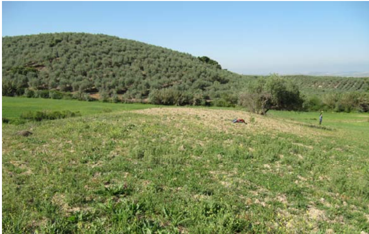
Promontorio donde se ubicara la edificación.

nueva planta pudimos constatar que dichas obras no inciden sobre ningún yacimiento arqueológico que presente restos superficiales.