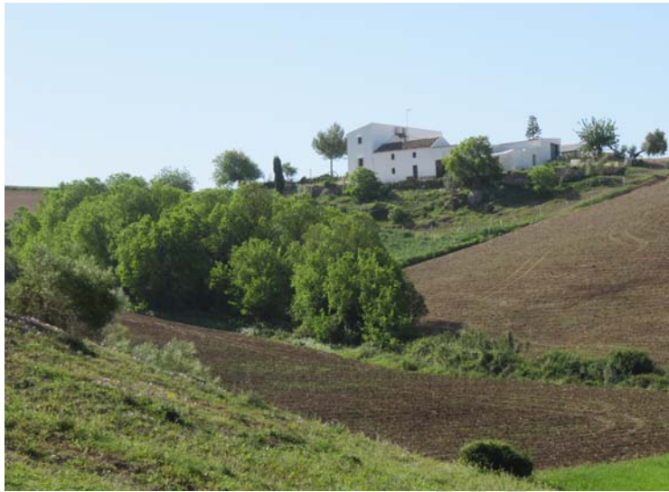
Cortijo existente en la finca.

inexistencia de yacimientos arqueológicos en la zona donde de prevé la construcción del complejo de turismo rural.