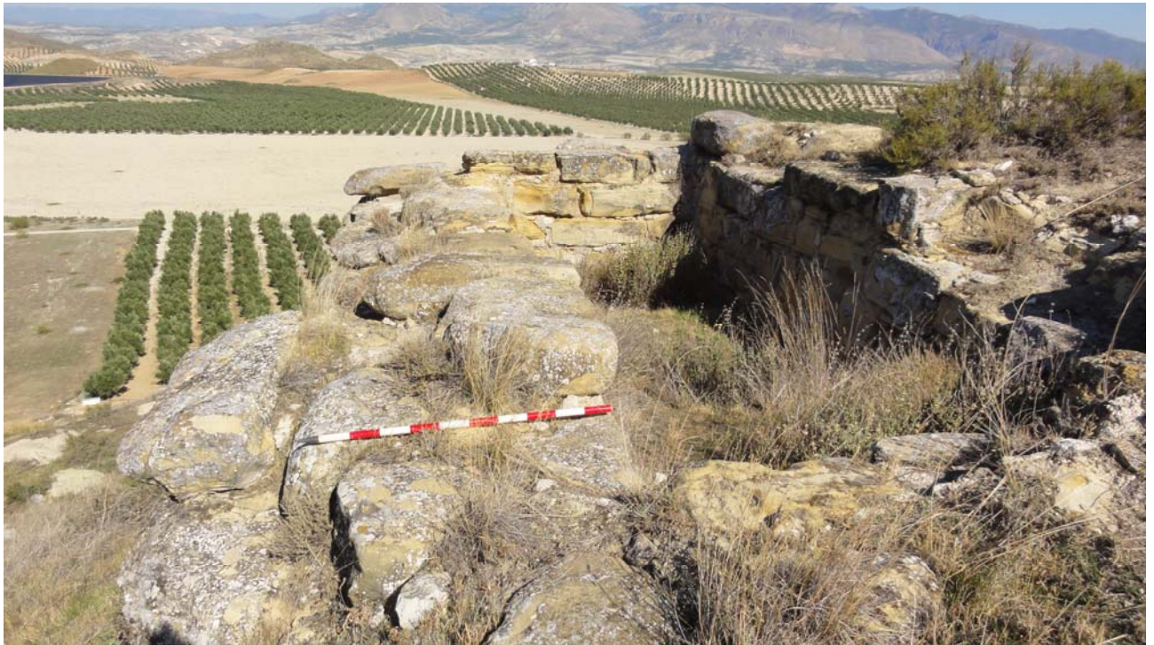
FOTO 2: El Castellón. Aljibe interior. Vista general hacia el Este.