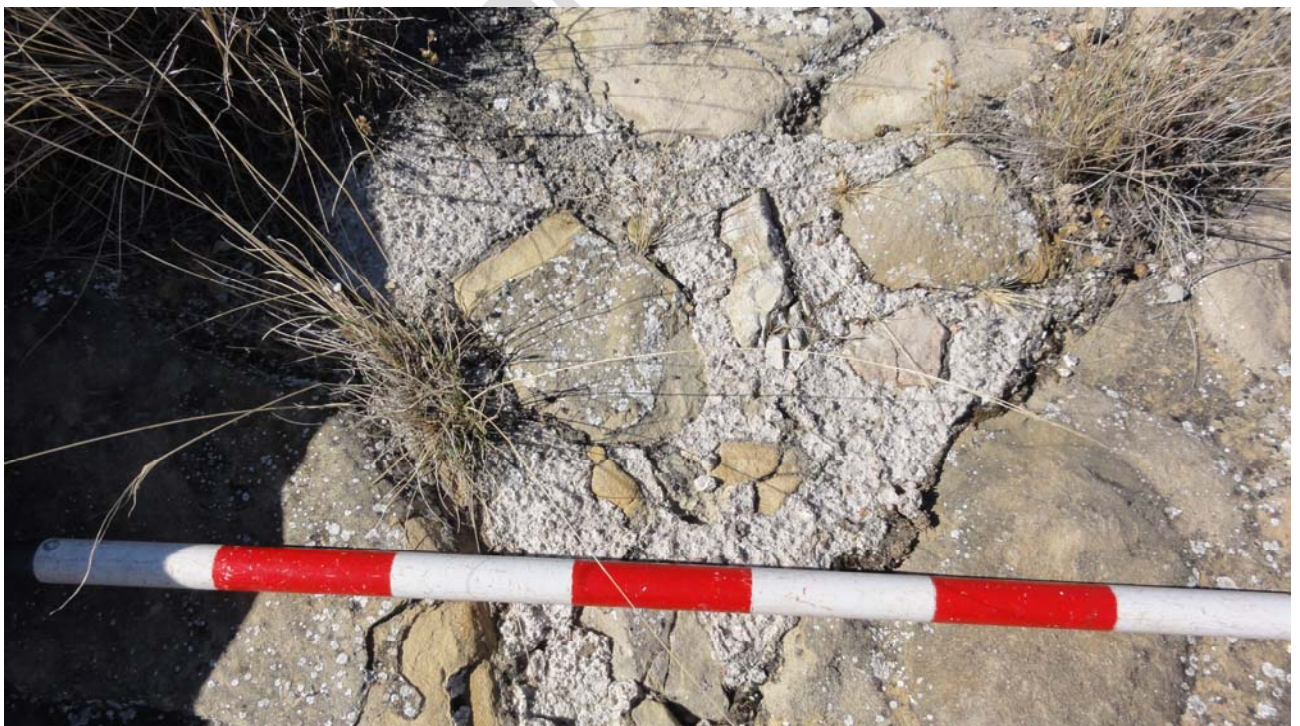
FOTO 3: El Castellón. Argamasa de cal y arena para trabar los sillares.