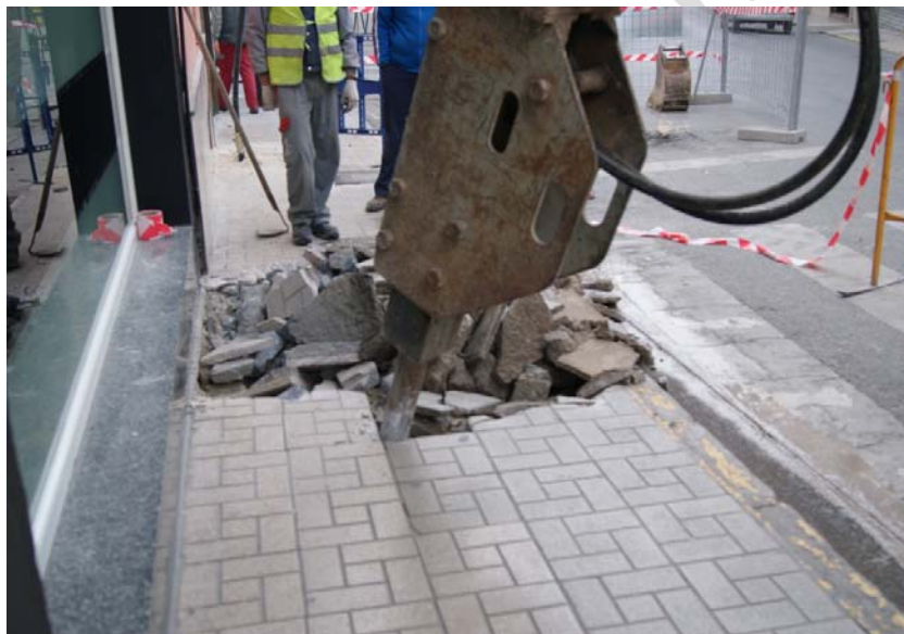
LÁM. 3. UC 1

UC 1: pavimento del acerado compuesto por adoquines.