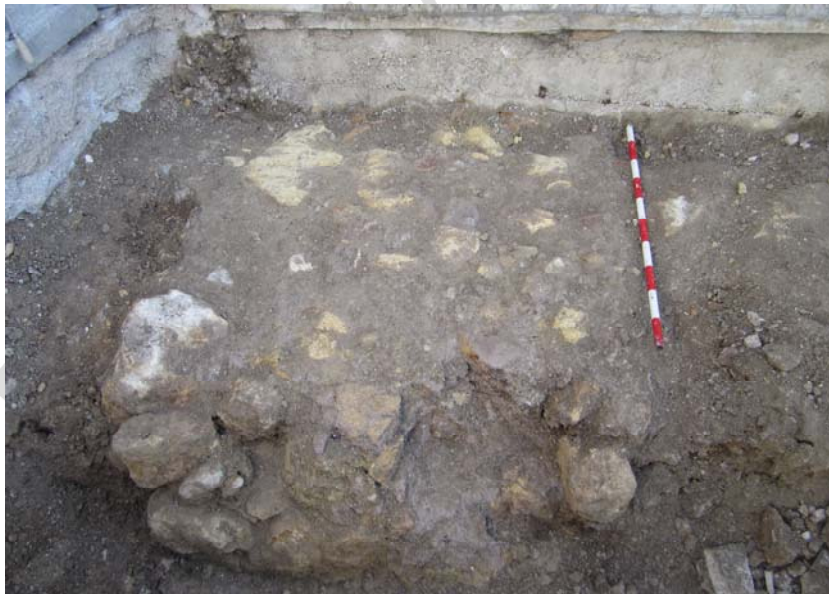
LÁM. 13. UC 3

UC3: zapata de cimentación de esa misma vivienda.