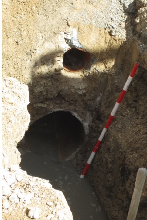
LÁM. 8. UC 3