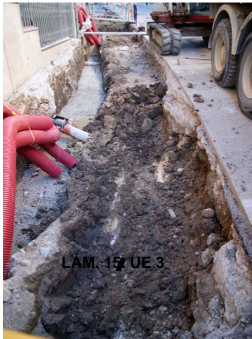
LÁM. 15 UE 3

UE 3: bajo las estructuras mencionadas (UC 2, 3 y 4) y la Unidad Estratigráfica 2, documentamos un depósito compuesto por tierra orgánica de tonalidad marrón equivalente al mismo estrato de cultivo del acerado sur.