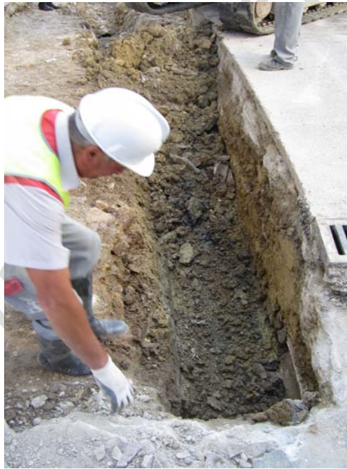
LÁM. 17-18. UE 4