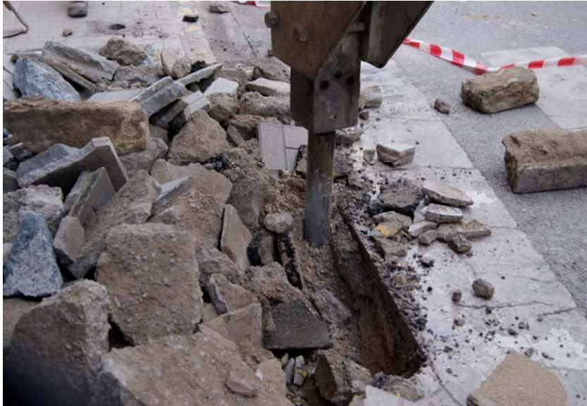
LÁM. 4. UE 1

UE 2: Nivel sedimentario compuesto por grava y arena localizado bajo el pavimento que conforma el acerado y que le sirve de nivelación al mismo.