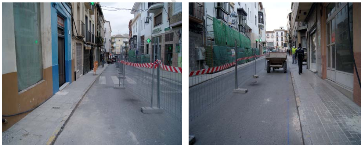
LÁM 1-2. Vista general de la calle Tejuela

En esta calle, en el tramo comprendido entre C/ Real y C/ Mesa, se han llevado a cabo obras de saneamiento, abastecimiento, alumbrado público y pavimentación incluidas en el Plan Provincial de Cooperación a las Obras y Servicios de Competencia Municipal y Carreteras del 2011.