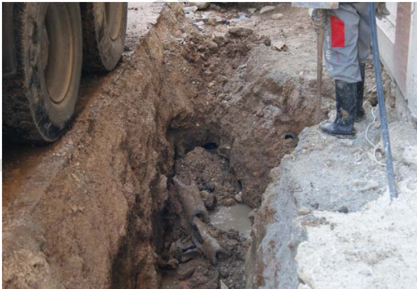
LÁM. 7. UC 3

UC3: sistema de saneamiento compuesto por una tubería de uralita.