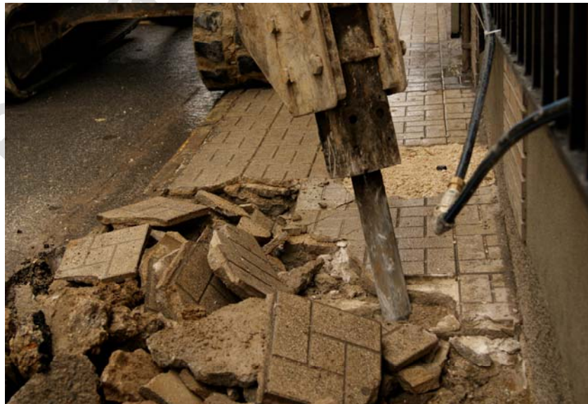
LÁM. 9. UC 1

UC 1: pavimento del acerado compuesto por adoquines.