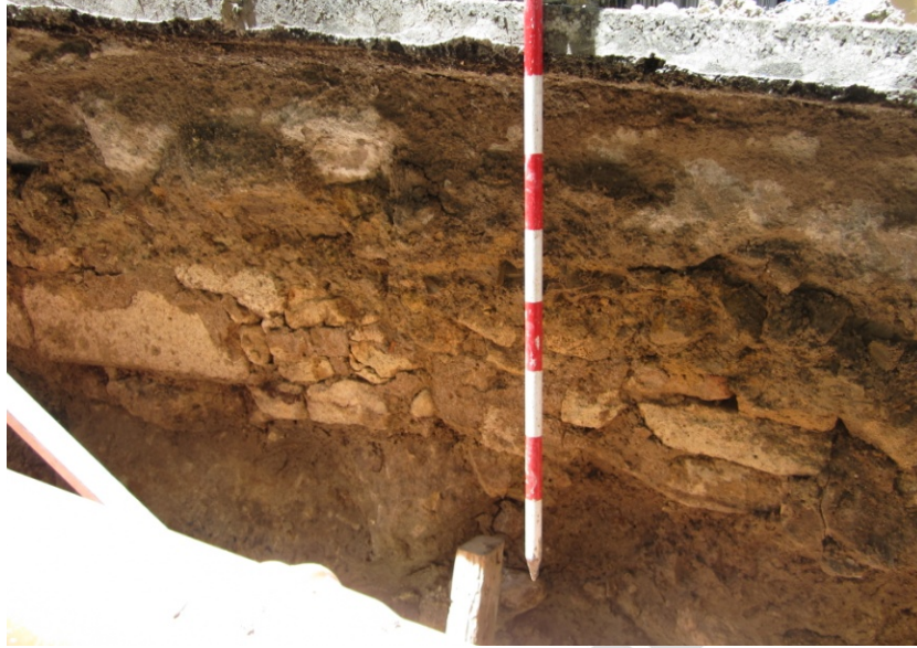
LÁM. 12. UC 2

UC3: zapata de cimentación de esa misma vivienda.