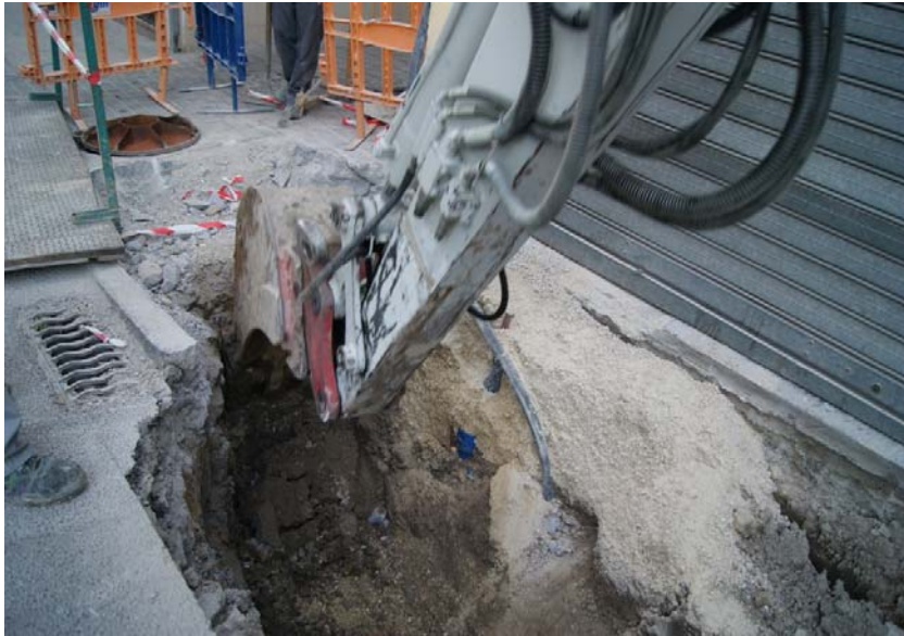
LÁM. 6. UE 3

UC2: se corresponde con la fosa de inserción creada para introducir el sistema de saneamiento antiguo. Corta a la Unidad Estratigráfica 3.