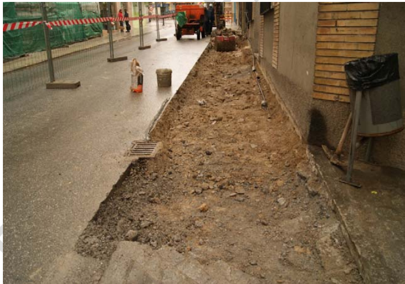
LÁM. 5. UE 2

UE 2: Nivel sedimentario compuesto por grava y arena localizado bajo el pavimento que conforma el acerado y que le sirve de nivelación al mismo.