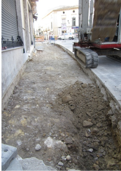
LÁM. 11. UE 2

Bajo este nivel estratigráfico localizamos varias estructuras que parecen relacionarse con el sistema de cimentación perteneciente a una vivienda, fechada probablemente a finales del siglo XIX o principios del XX, localizada en la línea de fachada norte del acerado: