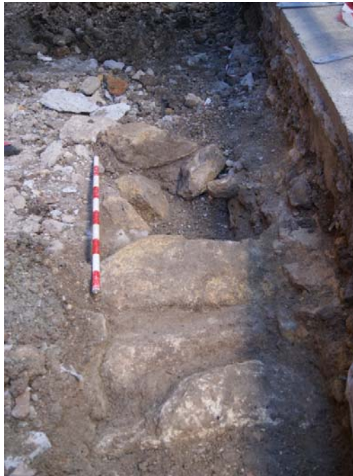
LÁM. 14. UC 4

UC4: atarjea de piedra localizada por debajo de la Unidad Estratigráfica 1, en el flanco sur del acerado.