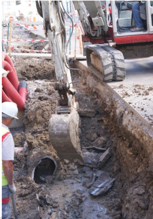
LÁM. 16. UC 6

UC6: tubería o sistema de desagüe de uralita.