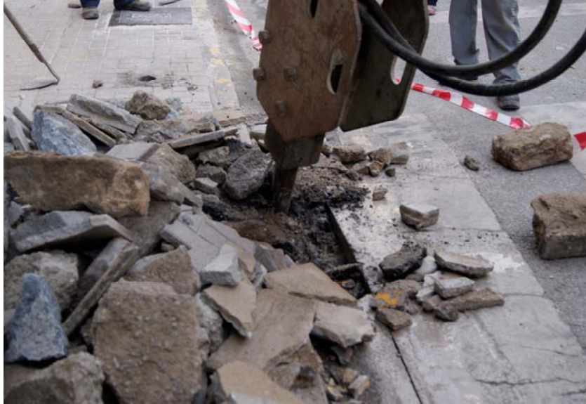
LÁM. 10. UE 1

UE 1: Nivel sedimentario compuesto por hormigón localizado bajo el pavimento que conforma el acerado y que le sirve de aglutinante al mismo.