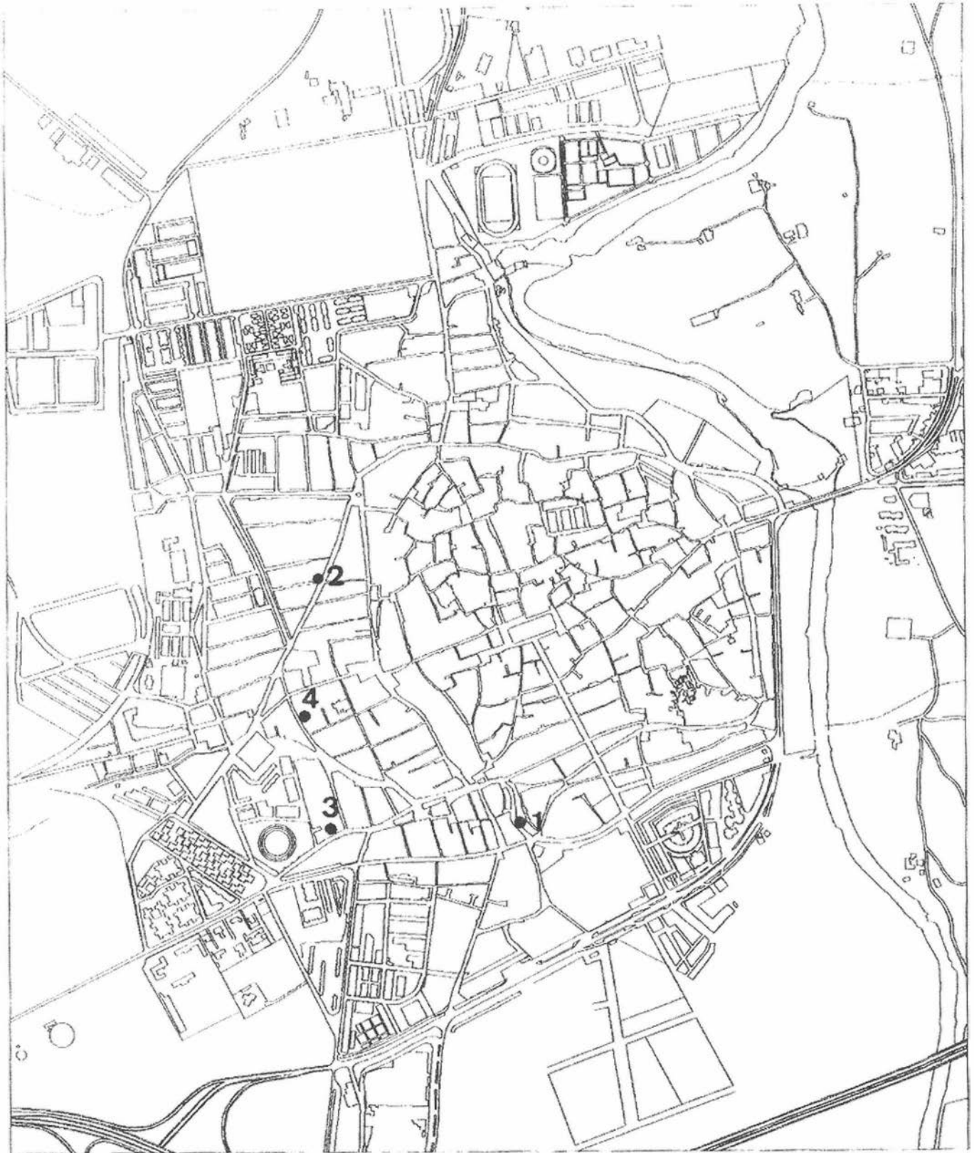
FIG. 1. Situación de los solares intervenidos.

Una vez hormigonada la zona periférica del solar, se pudo proceder al: