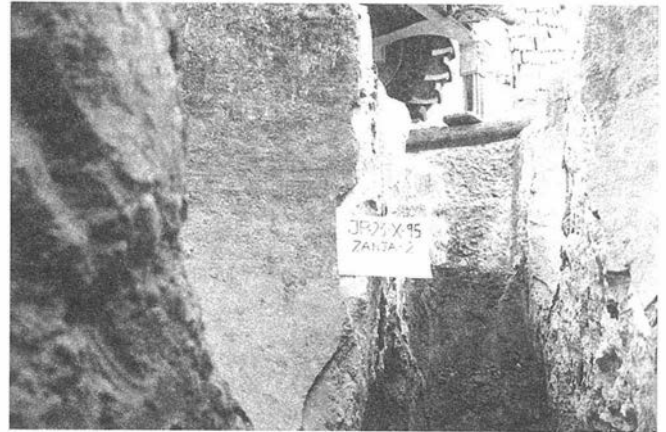
LAM. III. Intervención en calle Juan Páez 7. Detalle de los contenedores cerámicos.