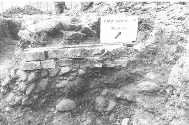
LAM. II. Calle Empedrada 34. Detalle de la estructura posiblemente romana.