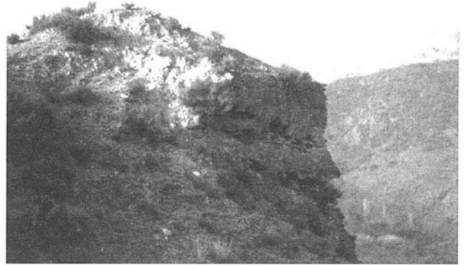
LAM. I. ḥiṣn Ballūr.

«poco usado por su aspereza, del cual nace un río, que corre por vajo de Valor, y se une, (á medio cuarto de distancia a Uxixar, hacia la parte del Norte) con el que llaman de Nechite, y junttos corren por ella hasta el mar Mediterraneo».