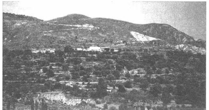
LAM. II. Alquería-despoblado de Turrillas.