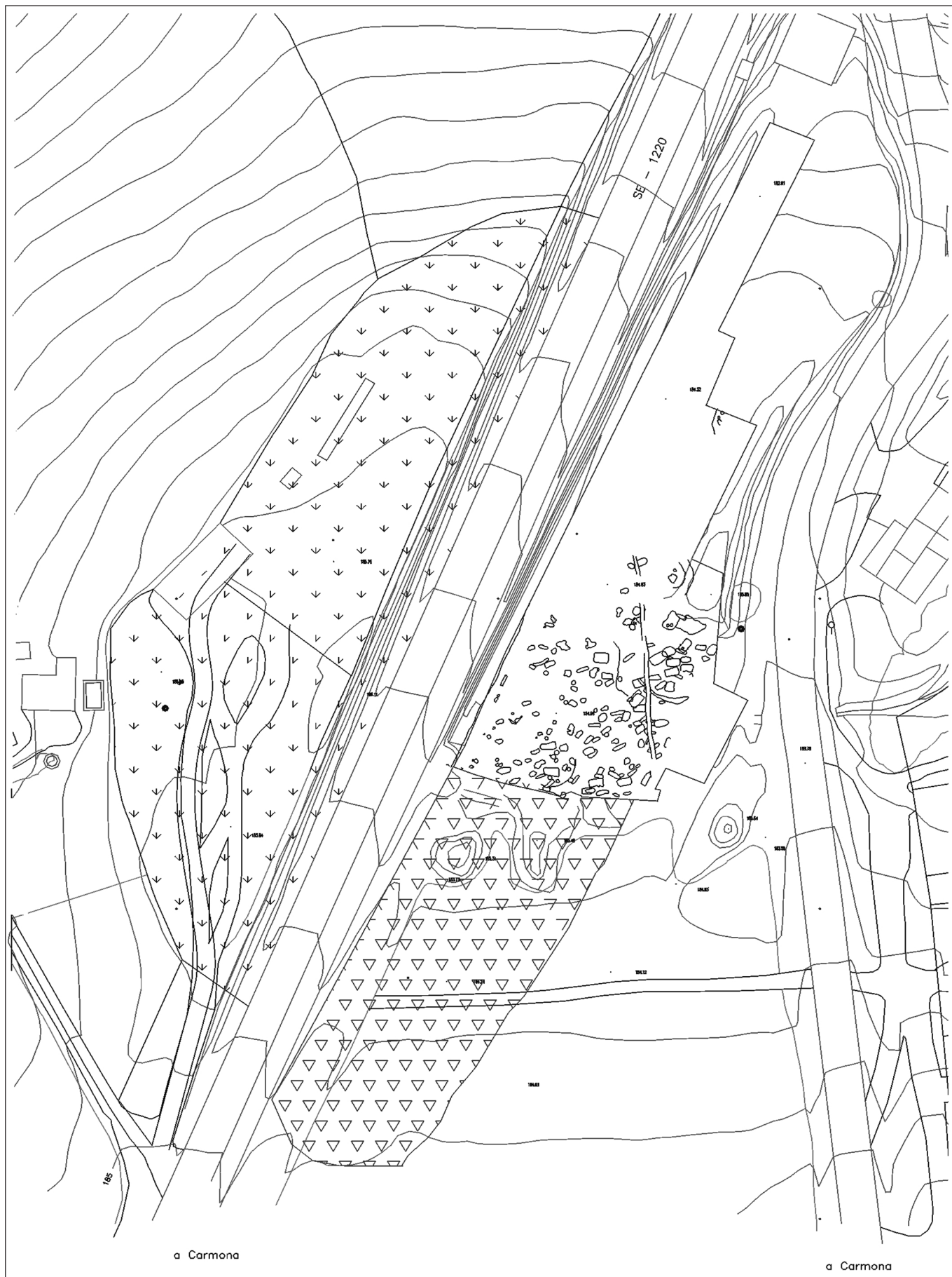
FIG. 2: Planta general del yacimiento con las estructuras halladas en el sector oriental (1990-1997); trama de triángulos: área destruida estimada; trama vegetal: área de protección propuesta (sector occidental de la necrópolis).