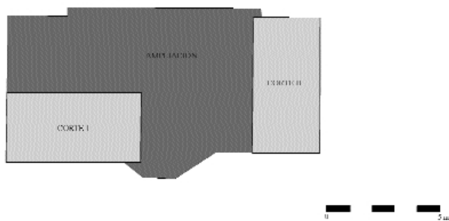
Plaza de las Monjas. Proyección de la superficie intervenida.