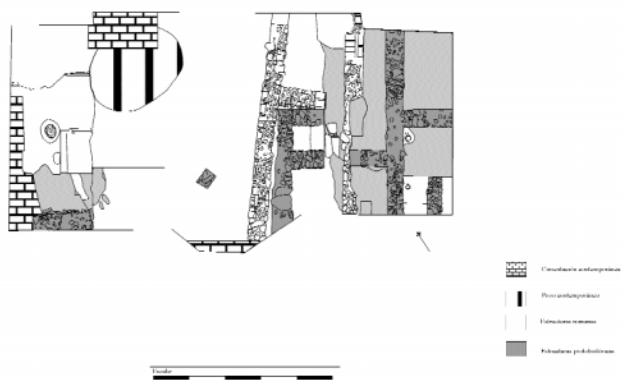
Fig. 2. Planta general.

nas. Se trata de sedimentos arrastrados desde zonas más altas de la ciudad donde también aparecen materiales protohistóricos. La última fase de ocupación romana consistió en una escombrera que abarca toda la superficie excavada con unos 20 cms de grosor. Bajo la escombrera, un nivel de casi 1 metro de potencia cubre las estructuras más importantes: parte de una pileta de salazón y parte de un edificio relacionado con la misma a través de un suelo de tierra apisonada, dividido en dos estancias separadas por una puerta. Este edificio presenta al umbral de entrada así como otro acceso, posiblemente a otra habitación que no se conservó, a través de dos escalones contruidos con dos grandes lajas de pizarra. Los materiales asociados a estas estructuras aportan una cronología a partir del siglo I d.C. y su potencia máxima es de -2^{\circ}70 metros. La falta de elementos constructivos, como por ejemplo los ladrillos de la pileta de opus signinum y, probablemente de los muros del edificio, pueden corresponder a un momento de abandono y reutilización de los materiales.