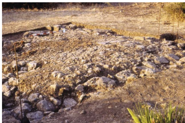
LAM. V. Corte 2, estructura 1: pavimento romano de opus signinum .

Ubicación: Nivel superficial que rodea a la Estructura 2.