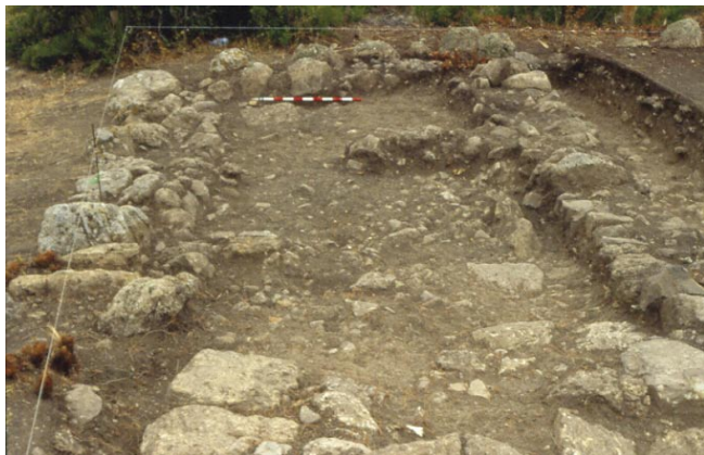
LAM. III. Corte I, estructura 2: edificio de época medieval.

conservado. Todos los muros son de factura muy tosca y se realizaron con mampuesto de piedra caliza trabado con tierra. Parece tratarse de una construcción de funcionalidad agrícola o ganadera de poca entidad constructiva y de poca perduración en el tiempo.