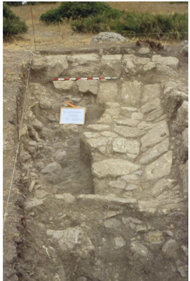
LAM. IV. Corte I, estructura 3: edificio de época romana.