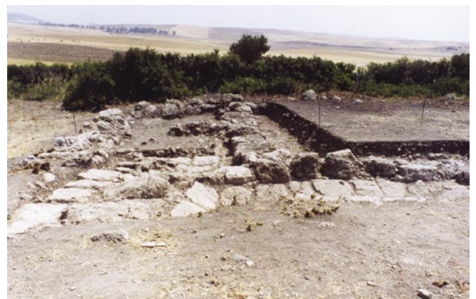
LAM. II. Corte 1. Vista general.

La excavación arqueológica de 2002 en el cerro de “El Esparragal” se realizó en la parte más alta de este (lám. 2), afectando