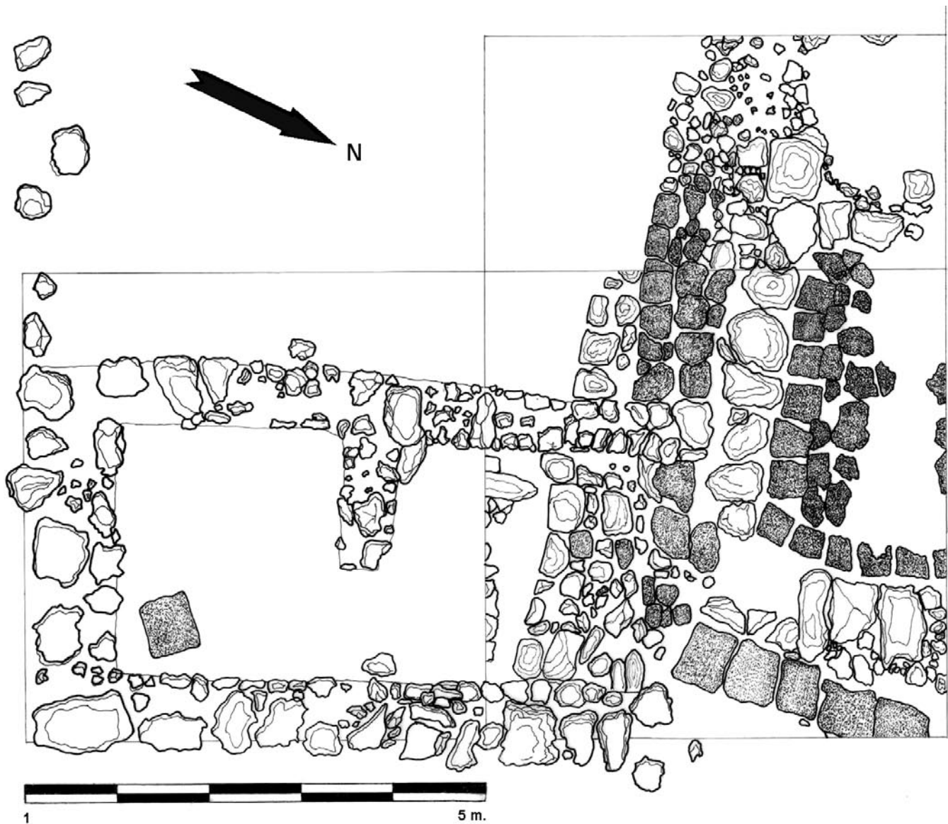
FIG. 1. Plano general de las estructuras del corte 1.

Pueden señalarse dos conjuntos de edificios que ocupan el sector oriental y el occidental del cerro, presentando en su estado actual más entidad las situadas al Oeste del mismo.