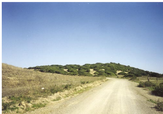
LAM. I. Vista general del yacimiento de El Esparragal.

Sobre el cerro (lám. 1), se apreciaban antes de la excavación una serie de muros rectilíneos orientados en dirección aproximada N-S y E-O, realizados con aparejo irregular y reforzados en los ángulos con sillares ligeramente escuadrados. La vegetación de monte bajo y matorral (lentiscos) que cubría el cerro y que en buena parte había arraigado sobre las estructuras arqueológicas impedía en principio una visión clara de la disposición de los muros, aunque donde ésta se hacía menos densa permitía apreciar la existencia de una serie de habitaciones cuadrangulares de grandes dimensiones (10 x 10 m aprox.) con similar orientación y que parecían formar parte de un conjunto de ámbitos con una ordenación estructurada.