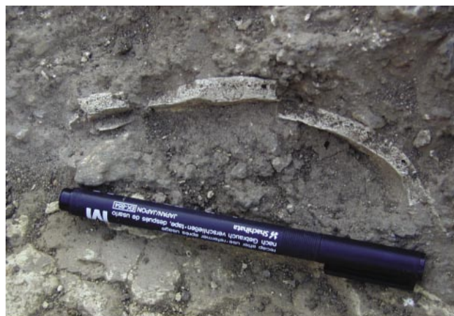
LÁM. II. Resto cráneo.

En el extremo E de la estructura se documentaron restos óseos muy deteriorados pertenecientes posiblemente a un cráneo (Lám. II).