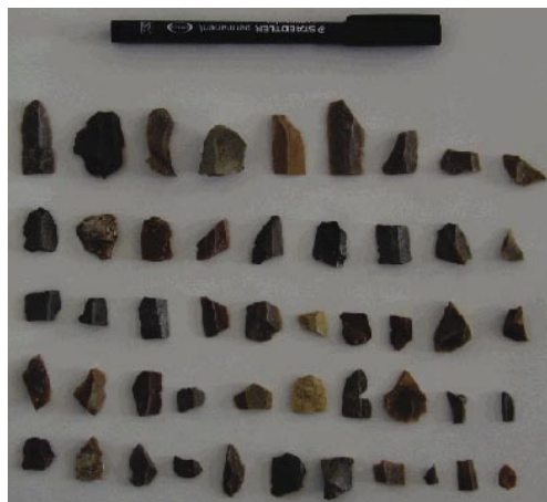
LÁM. IV. Láminas y restos de talla.