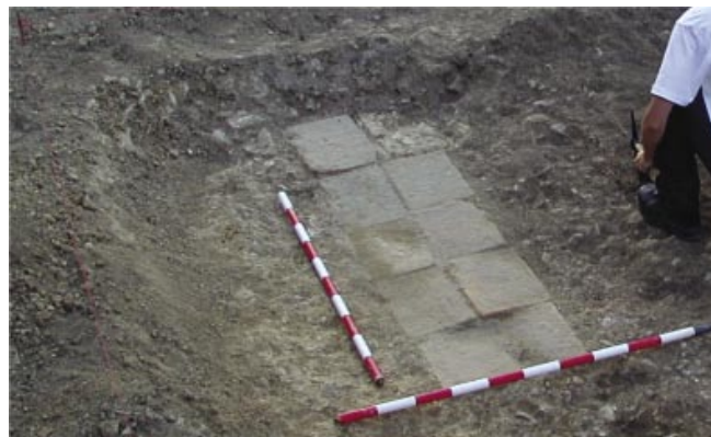
LÁM. I. Restos tumba romana.

Durante la documentación de los restos de la posible sepultura de inhumación se pudieron observar 12 losetas de barro de dimensiones 20x28cm pertenecientes con seguridad al suelo de la estructura (Lám. I). Éstas, junto con los 5 ladrillos rectangulares (20x28cm) que fueron desmontados con anterioridad al inicio de la intervención, formarían parte de la sepultura de inhumación. Las losetas fueron documentadas a unas cotas de +1'44 (W) +1'51 (E).