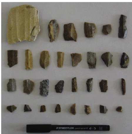
LÁM. III. Núcleo, láminas, restos de talla.