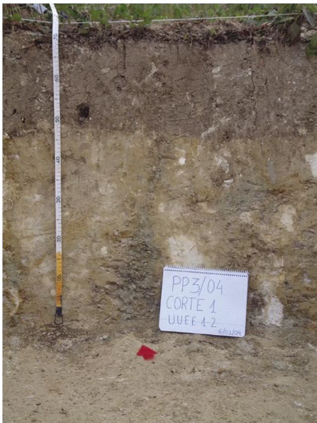
FIG. 3. Estratigrafía tipo de los sondeos practicados.

se situarán en aquellos lugares donde la concentración de material era mayor. Estos sondeos se separaron entre sí 25 m.