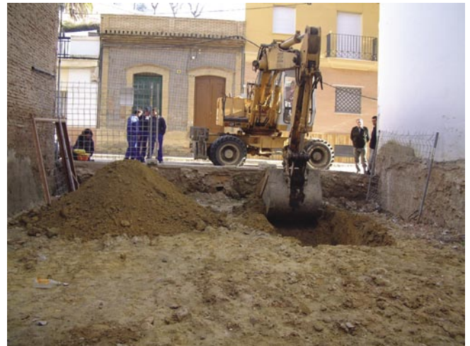
FIG. 3. Fotografías del proceso de excavación.

En esta fase se engloban las UE's 4, 5 y 6, aparecidas en la zanja –sondeo. Estas unidades están compuestas por margas verdosas que presentan inclusiones de malacofauna, más presente en la