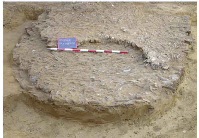
FIG. 4. Estructura de pizarras documentada.

UE 5 que en las otras dos. Por las referencias y documentación consultadas estos niveles forman parte del nivel de base del cabez de la ladera sur del Cabezo de la Esperanza