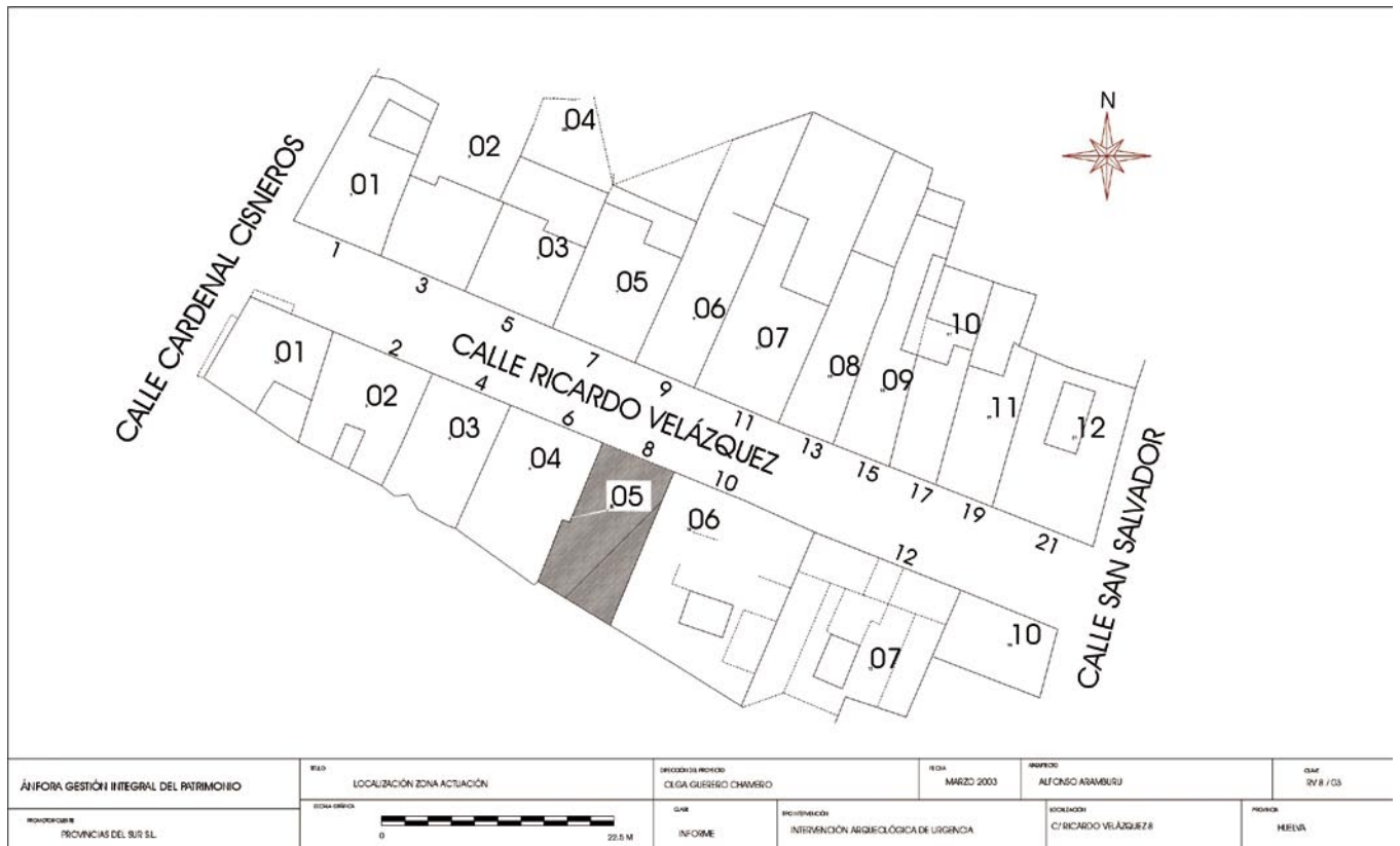
FIG. 1. Localización del solar.