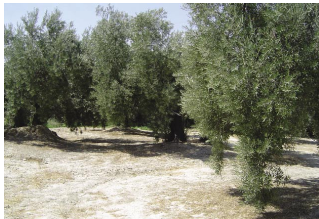
LAM. III. Vista Gral. Del Yac. Galipollo II.

Almacenamiento/Transporte. En superficie se observa escaso material constructivo romano ( tegulae y lateres ), aunque presentan un alto grado de fragmentación y deterioro.