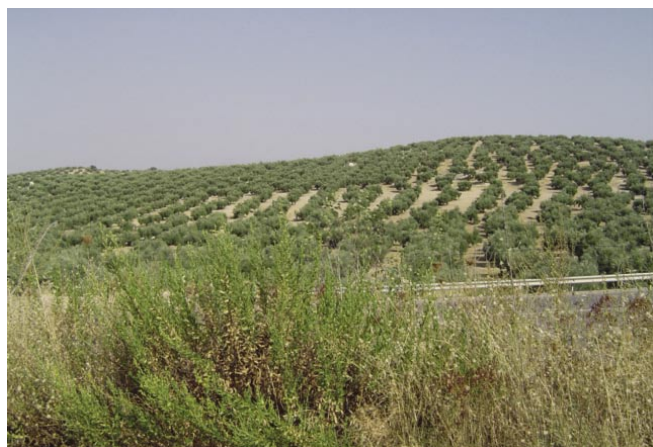
LAM. II. Vista Gral. Del Tac. Cortijo de Barreras.

DESCRIPCIÓN DE LOS RESTOS ARQUEOLÓGICOS: La caracterización del yacimiento se ha realizado exclusivamente atendiendo a la dispersión superficial de materiales arqueológicos.