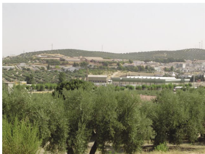
LAM. I. Vista Gral. del Yac. Polideportivo de Martos.

DESCRIPCIÓN FÍSICA: El yacimiento se localiza en el margen oriental de la carretera. Es una zona ampliamente urbanizada que conecta con el casco urbano. Aún se mantienen, sin embargo, usos periurbanos: fincas residenciales, olivares y alguna parcela de frutales. En general, es una zona llana, con presencia de arroyos en el entorno.