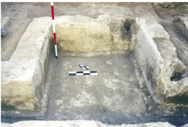
LÁM. III. Detalle de depósito del ninfeo con revestimiento hidráulico.

No se documenta la cota de uso de este momento, ya que la incidencia de las actuaciones bajomedievales es bastante impor-