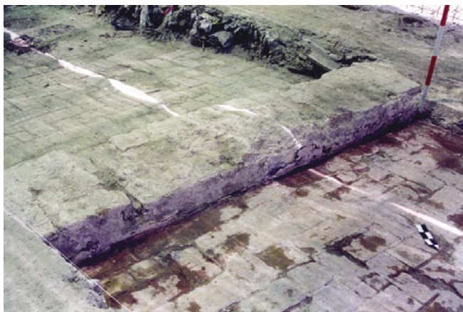
LÁM. V. Detalle de estructuras modernas. Pavimentos y muro.

Se produce una remodelación en la vivienda construida a finales del siglo anterior, se anulan algunas dependencias del sector norte, se pavimenta de nuevo siguiendo los modelos de la época, con ladrillo dispuestos a la palma, se le añade una planta más a la vivienda, tal y como señala la construcción de la escalera en la zona de patio y se ejecuta un sistema de canalización y desagüe que vierte en el patio.