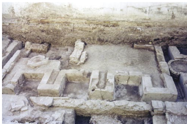
LÁM. I. Vista general de los hallazgos documentados en la parcela.

Una vez consensuada con el responsable de Seguridad y Salud las dimensiones y ubicación de la cuadrícula planteada, se realiza su excavación con medios manuales, documentándose la estratigrafía hasta llegar al nivel freático (situado a -3 m. aproximadamente desde la rasante del solar). A una cota de -1'50 m. se detectan en el sector este de la cuadrícula la aparición de las estructuras romanas. Una vez inspeccionados los trabajos tanto por el arqueólogo de Urbanismo como por el arqueólogo inspector procedimos a la ampliación de la cuadrícula en dirección este -emplazamiento de las estructuras romanas-.