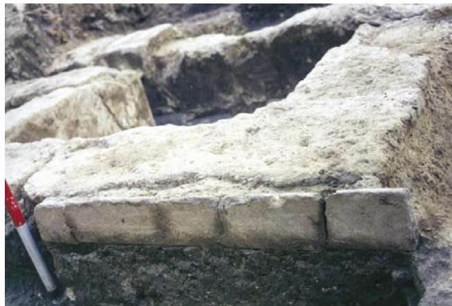
LÁM. IX. Detalle de aplacado marmóreo del ninfeo.