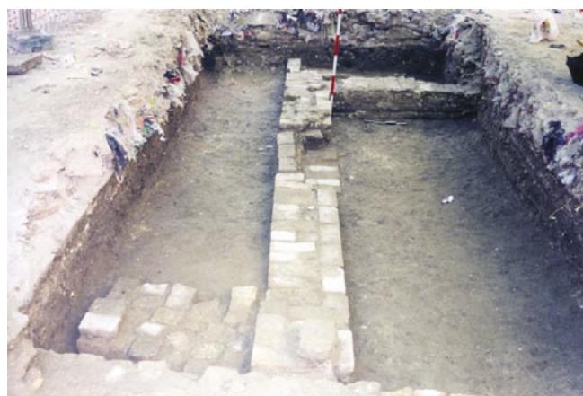
LÁM. VI. Planta de estructuras mudéjares.

Claudia, en un momento entre los años 50-60 d.C., cronología avalada por la cerámica que se registra en las primeras unidades de estratificación exhumadas en esta intervención, y que se corresponden, al igual que se han documentado en las intervenciones arqueológicas desarrolladas en la Plaza de España 7 y en la calle Virgen de la Piedad y calle Regidor 8 , con capas de relleno que suponen una preparación del terreno y una subida de cota del mismo, que en el caso que nos ocupa, se acentúa por el inicio en sus inmediaciones de una vaguada formada por el cauce del arroyo Matadero que discurría cercano al solar.