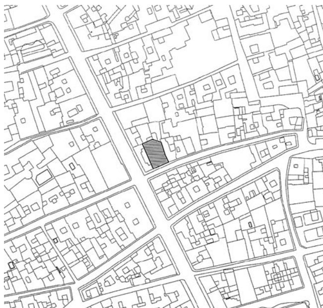
FIG. 1. Localización urbana de la parcela.

Se encuentra delimitado al Norte por el tramo de muralla que, describiendo un arco más o menos convexo, enlaza la Puerta de Osuna con la de Estepa; al Sur del solar y perpendicular al mismo discurre el curso del Arroyo Matadero, actualmente encauzado, mientras que al Oeste la Avenida Miguel de Cervantes, vía abierta a finales del siglo XIX, facilita la comunicación entre la Carretera Nacional Madrid-Cádiz y el centro de la Ciudad. Dado que en este sector de la ciudad ha habido desde principios del siglo XX una gran actividad constructiva, los lienzos de muralla y torreonnes han sido progresivamente desmantelados, quedando hoy únicamente los rastros de sus cimentaciones en las medianerías de los inmuebles colindantes.