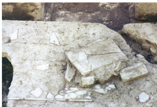
LÁM. VII. Detalle de estructuras romanas. Restos de opus sectile bajo derumbe de tégulas.

Una vez que los niveles de base son aptos, se ejecuta la construcción de una estructura hidráulica, documentada en gran parte de la superficie del solar y que identificamos como U.E. 74 9 . Tanto por sus características formales como estructurales, la identificamos como una fuente, estanque o ninfeo de grandes dimensiones, recorrida por un canal perimetral y con al menos cinco pilones, de los cuales tres hemos podido documentar en su totalidad, y dos de ellos se adivinan bajo la medianería oriental del inmueble.