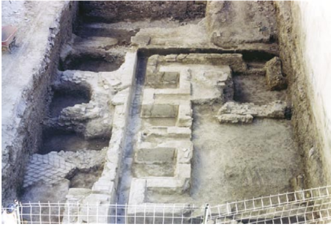
LÁM. II. Vista general del ninfeo.

revestimientos) parece apuntarnos hacia una obra pública, quizás una zona ajardinada que da acceso al Foro de la Colonia y que además permitiría el abastecimiento de agua a la población. Por otro lado no podemos descartar la posibilidad de que estemos en un área residencial y nos situemos en un fantástico ninfeo ubicado en el peristilo de una domus , atendiendo sobre todo a las intervenciones realizadas en solares aledaños hacia el Este.