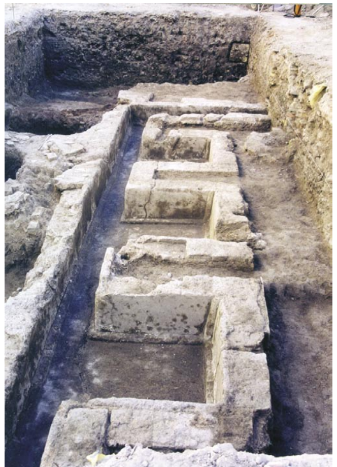
LÁM. IV. Detalle de estructuras romanas. Canal perimetral del ninfeo.

Tras el periodo de tiempo en el que el solar es utilizado como cantera y como vertedero, se documenta nuevamente la ocupación del espacio, esta vez como zona de uso doméstico. Tras una preparación del terreno se comienza con una nueva fase constructiva, con la proyección y ejecución de una vivienda.