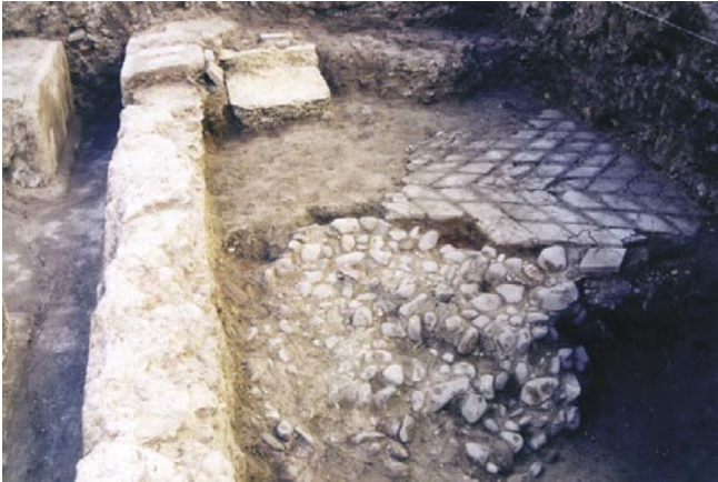
LÁM. VIII. Detalle de estructuras romanas. Pavimento de opus reticulatum y cimentación de cantos rodados del canal perimetral del ninfeo.

El patrón de medida utilizado para la construcción de dicha fuente es el palmo mayor; las medidas documentadas son de 50 palmos mayores 10 de lado en el muro exterior de cerramiento de la cara occidental (lado documentado en su totalidad) y 44 palmos mayores en su cara interna, correspondiente al interior del canal.