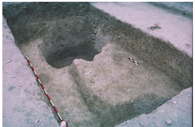
LÁM. IV. CD: D. Cimientos de cal.

corresponden con pozos de vertidos que fueron colmatados por abundantes restos materiales constructivos y cerámicos, de entre los cuales se ha podido constatar los desechos de hornos tanto las escorias de cerámica, escorias de metal, fritas de horno y material cerámico defectuoso, así como la utilización de atifles. Estas capas de vertidos nos pone en relación la actividad artesanal que tuvo que existir en la zona durante el periodo mudéjar, fundamentalmente con hornos cerámicos. (lám.IV)