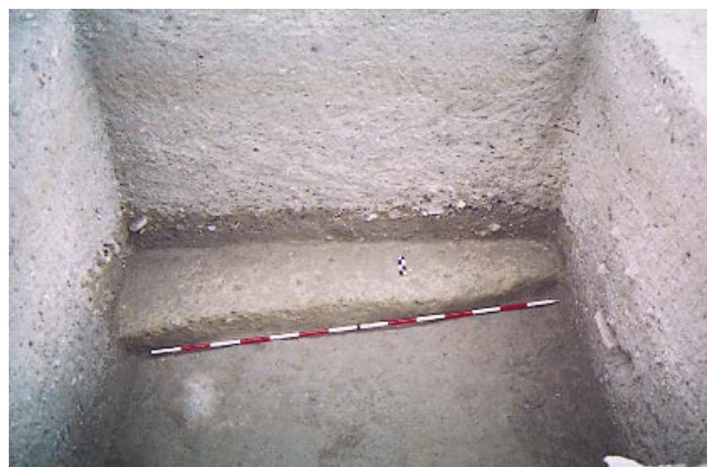
LÁM. I. CD: B. Cimientos de cal.

A partir de los pavimentos documentados de la fase anterior, realizados con cal, gravilla y tierra, evidenciamos un proceso que abarca toda la modernidad y el periodo contemporáneo donde la parcela pasa a formar parte del Monasterio de Santa Inés convirtiéndose en la zona de huertas y manteniendo el uso agrícola hasta finales del siglo XX. En este proceso la parcela se va colmatando con capas de relleno con un alto componente de humus y escasos materiales. (Lám. II)