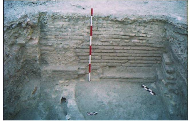
LÁM. VI. Infraestructuras de las unidades habitacionales del convento.