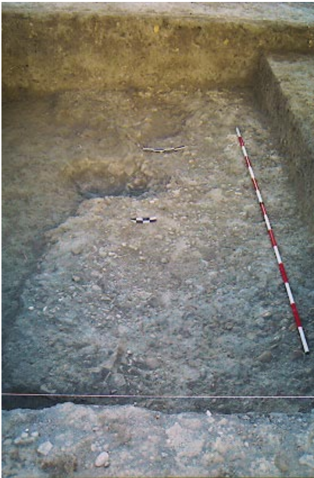
LÁM. II. CD: A. Pavimento de cantos rodados, cal y tierra.

XV hasta la actualidad, cuando es comprado a finales de los años ochenta, construyéndose una fábrica y almacenes, a la vez que es utilizado como área de tránsito de camiones de carga.