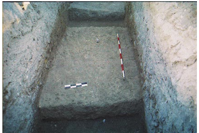
LÁM. III. CD: D. Cimientos de cal.

Esta estructura queda soterrada, en un proceso lento pero continuo, por capas de relleno y vertidos que desde finales del periodo islámico hasta la fundación del Monasterio (1486) se constata en toda la parcela. De estas capas de vertidos hay que destacar aquellas que se datan a mediados del siglo XV y se