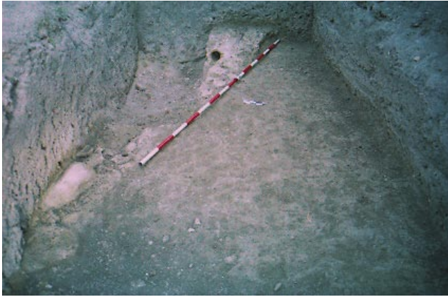
LÁM. V. Vista General de la cuadrícula A.