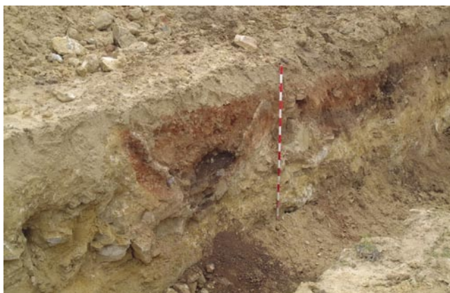
FIG. 3. Fosas localizadas.

Memoria Científica correspondiente, una nueva delimitación para el yacimiento, más acorde con los resultados obtenidos.