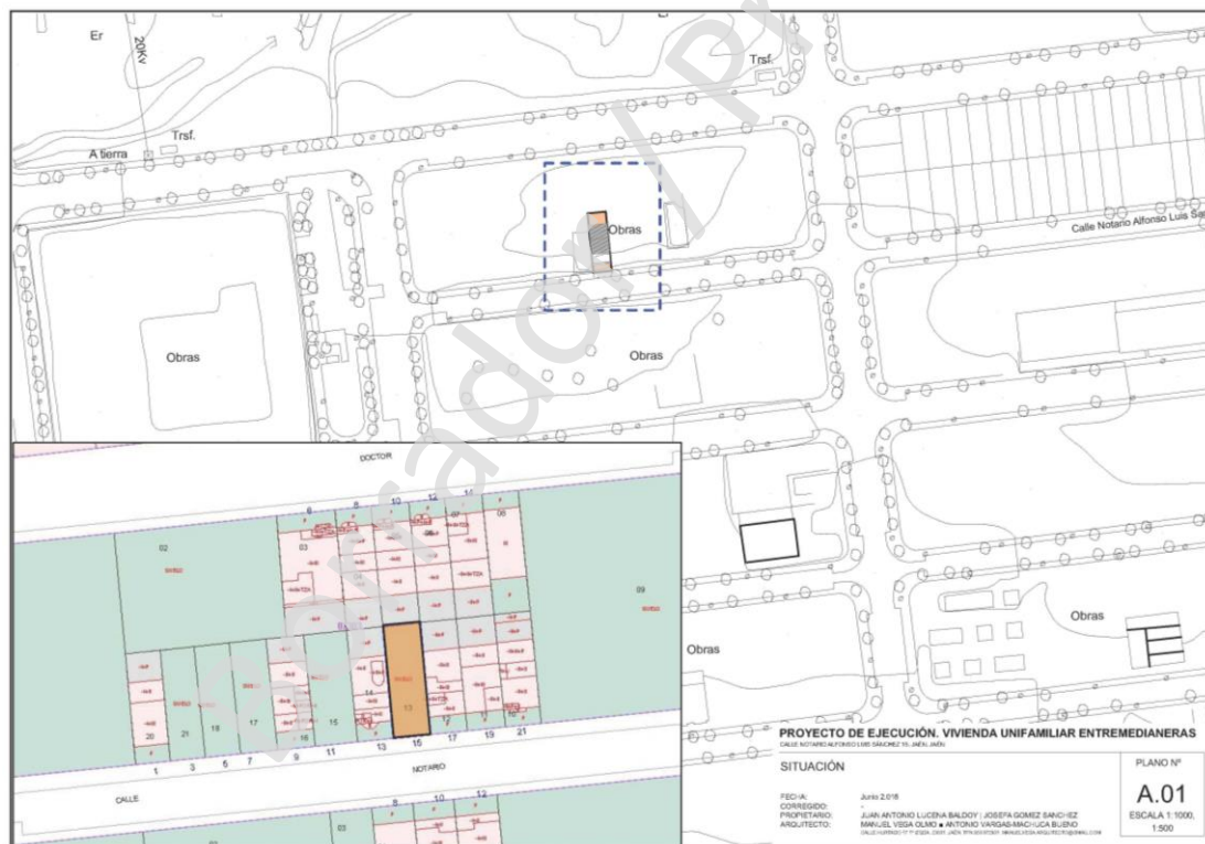
Plano de situación de la parcela en el entorno de Marroquíes Bajos.

The Preventive Archaeological Intervention in the RU 12-1K plot of the Archaeological Zone of the Zona Arqueológica de Marroquíes Bajos in Jaen, located in the north of the same, in the delimitation of "lake zone", shows a very steep slope and a total absence of remains materials, which indicates that this part of the territory was not occupied or, at least, there were no physical remains that indicate this fact to us.