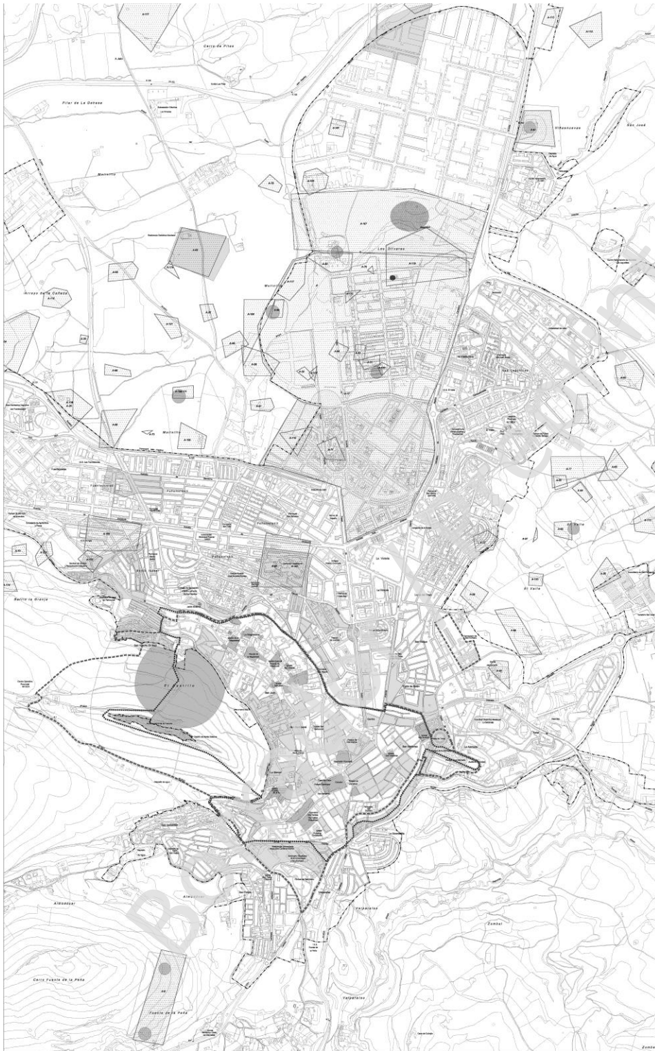
Plano 1. Situación de la parcela en el plano de Jaén. PGOU.