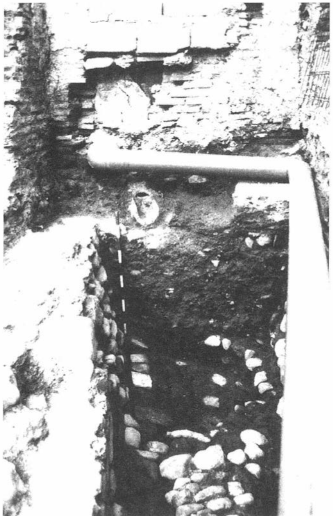
LAMINA II. Perfil este del sector sur.