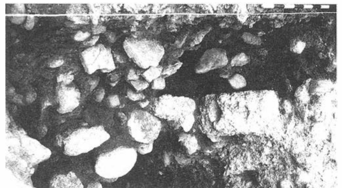
LAMINA IV. Estructuras y derrumbe medievales.

- Una nueva US se documentó bajo el empedrado anterior. Presenta una potencia de unos 20 cm. y al igual que las anteriores buza de norte a sur. La tierra es de color marrón oscu-