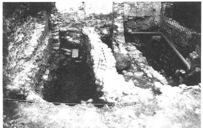
LAMINA I. Vista general de la excavación.

Se planteó un único sector, de 6.00 x 5.20 m., que ocupaba prácticamente la totalidad de futuro sótano. Sus dimen-