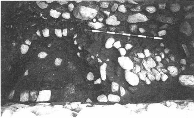
LAMINA III. Estructuras modernas: empedrado de cantos rodados y pavimento de ladrillos.

siones irregulares responden a los propios límites del solar: al norte por la calle San Juan de los Reyes, por la cual se accede, y al este y oeste por las medianerías de dos viviendas.