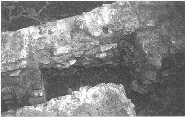
Fernando Labrada s/n. Detalle muro ocupando parte de una calzada romana.