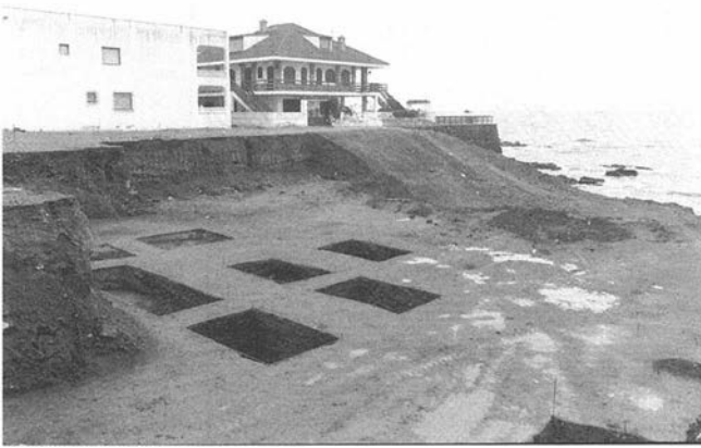
FOTO 1. Vista general de la excavación.

de tierra compacta y homogénea que presentaba, en su parte superior, restos de escoria reciente y bolsas de arena sobre la pizarra.