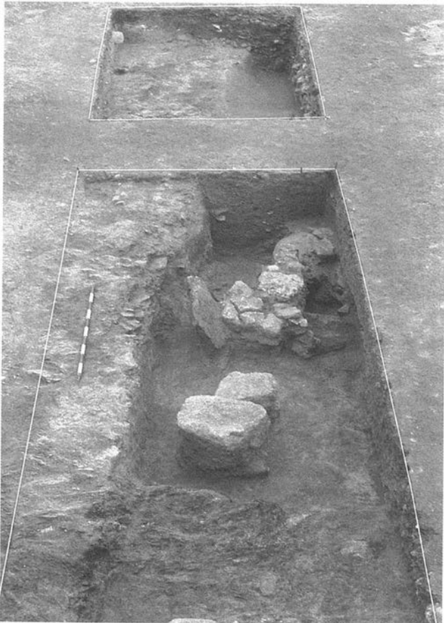
FOTO 2. Cortes I y VI.

niveles, siendo la profundidad mínima del superior 5,15 metros y la máxima del nivel inferior 5,94 metros. Se mantiene la orientación N/W-S/E ya documentada en el corte anterior. Cada uno de estos niveles presenta un vaciado de forma circular y con una profundidad de 0,3 metros.