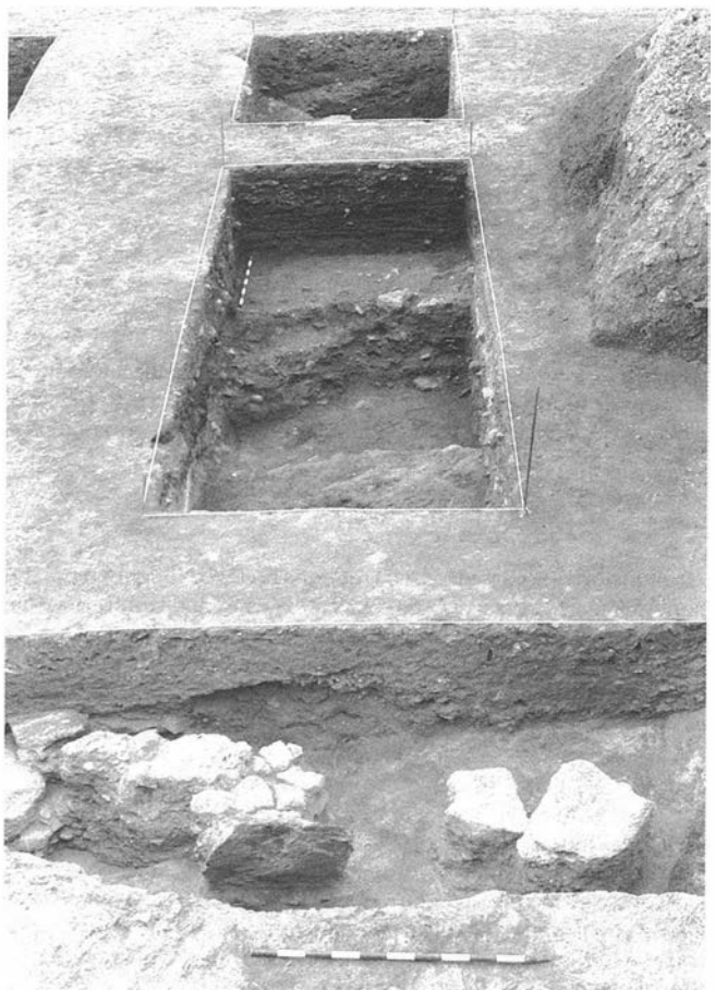
FOTO 3. Cortes I, II y IV.

Dimensiones 3 x 2 metros. Los niveles superficiales presentan una