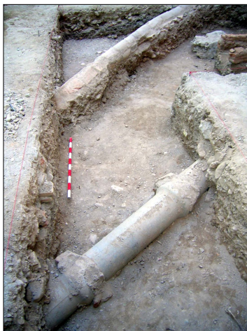
Foto: vista de las canalizaciones de fase contemporánea.

documentados en ellos eran de época contemporánea (plásticos, ladrillos huecos, vidrios de botellines, etc.) salvo alguna laja de pizarra y resto óseo procedente de la destrucción de la necrópolis.