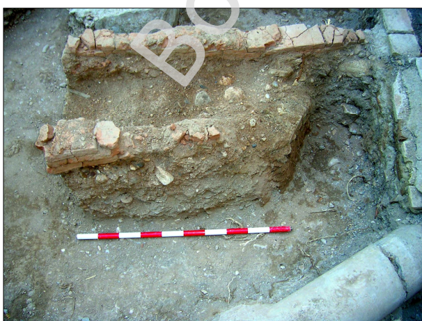
Foto: detalle de la sepultura CEF-1 una vez retirado el individuo.

La segunda: Destruída por la primera. Se trata del CEF-1 . El único testigo “in situ” que nos indica que la necrópolis estuvo en el solar. Se trata de una sepultura fabricada con muretes de ladrillo macizo dispuesto a soga. Se encontraba en muy mal estado de conservación, sin conservar la cubierta ni los muros de cierre por el Este y Oeste, ya que se encontraba seccionada por las canalizaciones contemporáneas y por el rebaje practicado en el nivel geológico para la fosa de cimentación de la vivienda.