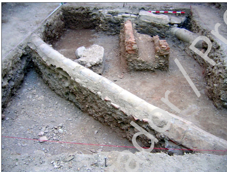
Foto: Vista parcial del sondeo una vez finalizados los trabajos de excavación.

Por otro lado hay que decir que si bien la construcción de la vivienda demolida a mediados del siglo XX supuso la destrucción de la necrópolis en el solar, podemos observar tanto por los restos mal conservados del CEF-1, como por las lajas de pizarra de enterramientos medievales reutilizadas en la cubierta de la canalización E-2, y las documentadas en los rellenos de nivelación de la vivienda (UEN 002 y 003), que la necrópolis de Puerta Elvira se localizaba por la zona, al menos en su fase más tardía.