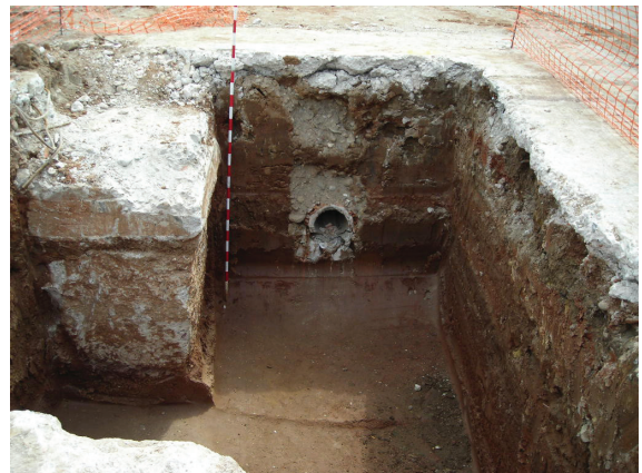
Fig.12. Sondeo 18. Perfil Este. En este sondeo, al igual que en el resto, se logró alcanzar el terreno geológico, pero la ausencia de consistencia de los rellenos documentados hizo imposible su limpieza manual.