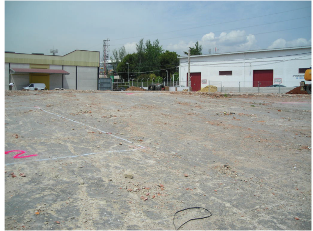
Fig. 2. Vista del solar desde el Oeste. En primer plano, replanteo del sondeo 1.