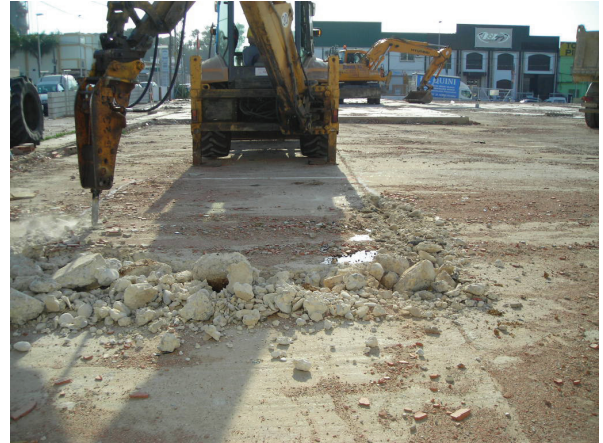
Fig.5. Retirada de la losa de hormigón con cazo de limpieza, una vez picado el contorno del sondeo 1.