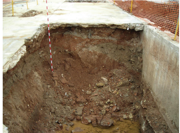
Fig.14. Sondeo 24. Único sondeo en el que se ha documentado restos de ocupación humana anterior a la construcción de la nave industrial, aunque también pertenecen a época contemporánea. Vista desde el Oeste.