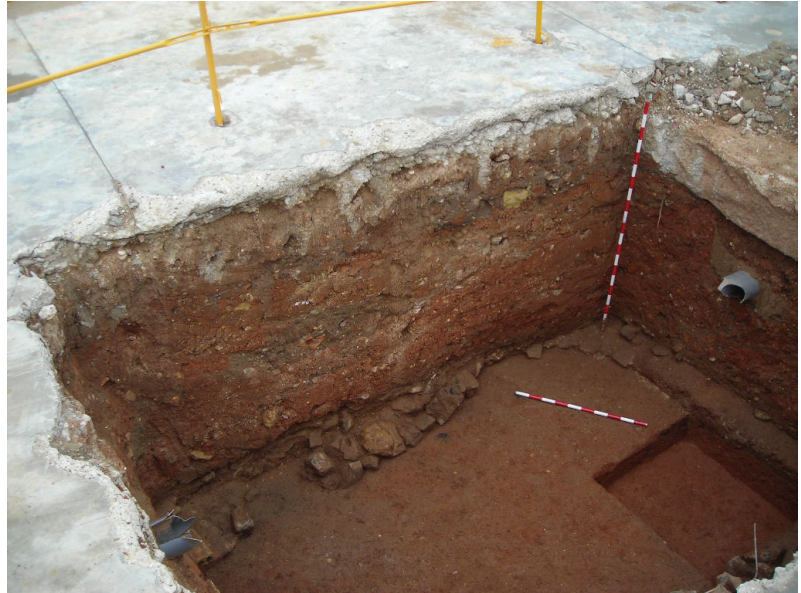
Fig.16. Sondeo 24. Perfil Sur.