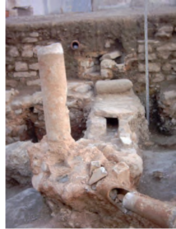
LÁMINA 2: U.E.C. 17, 18 y 19 (Canalizaciones).

LÁMINA 1: U.E. C. 14 (fuente), U.E.C. 20 y U.E.C. 7 (atarjeas).