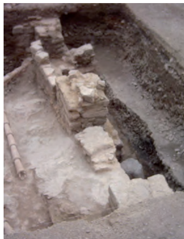
L MINA 4: U.E.C. 22 (muro sur) y relleno.