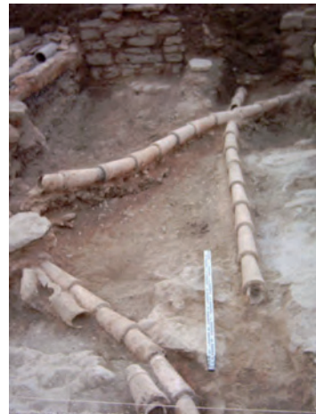
LÁMINA 3: U.E.C. 6 (atarjea).

LÁMINA 2: U.E.C. 17, 18 y 19 (Canalizaciones).