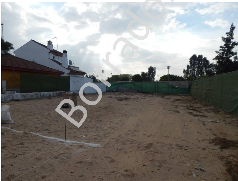
Detalle de la parcela en pleno replanteo.

La excavación que se realizó se ajustó al Proyecto de Construcción, llegando a una cota máxima de - 3.00 m. en el chalet (sótano) y de - 1.20 m. para la piscina , con respecto a la