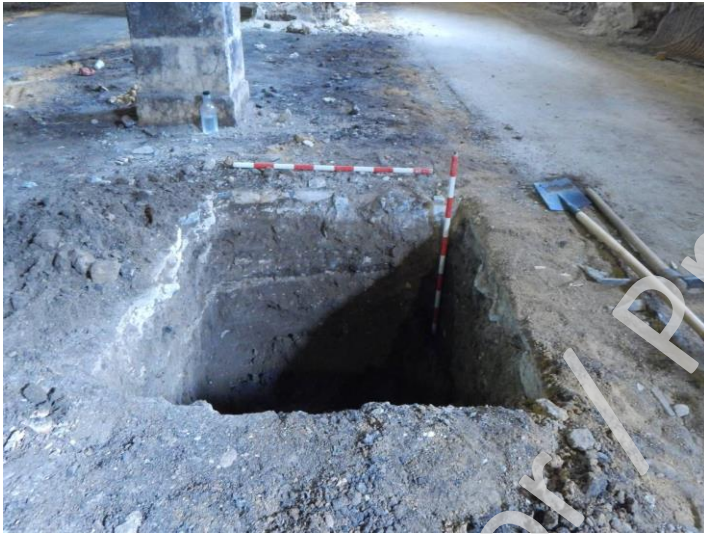
Detalle de sondeos manuales. Puede apreciarse la misma estratigrafía.

de (cascotes, morteros, sillares rotos, etc.). La cerámica aparecida es más bien escasa y de diverso tipo: cerámica de lujo (porcelanas de importación, vajilla fina de mesa, etc.) a cerámica común doméstica (ollas, platos, jarras, recipientes contenedores de líquidos de grandes dimensiones, lebrillos...), restos de tejas y cerámica industrial (también incluyendo restos de botellas y otros vidrios, botellas de caolín, etc.). Gran parte de estos restos es evidente que proceden de los cascos bodegueros contiguos, que llevaban algún tiempo ya en funcionamiento.