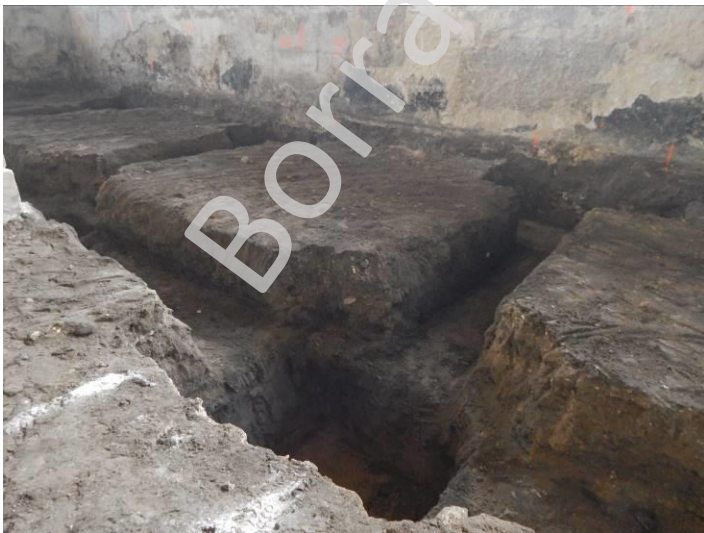
Detalle de pozos y correas donde se ha realizado el control arqueológico.