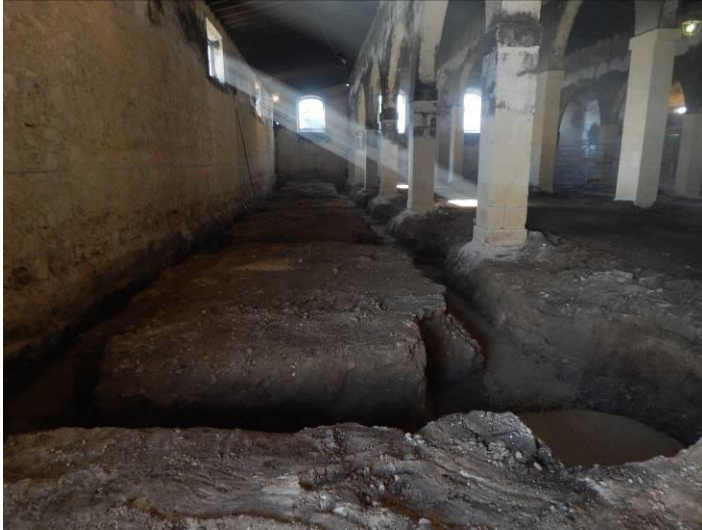
Detalle de pozos y correas a lo largo de la bodega.

Las conclusiones e interpretación que realizamos es variada. En primer lugar, constatamos la importancia de la intervención por partida doble: 1) se trata de una zona de la ciudad que apenas se conoce y que ha ofrecido resultados que van conformando el desarrollo de la ciudad de El Puerto de Santa María a lo largo del tiempo, especialmente en esta etapa contemporánea en la que se construye el conjunto bodeguero y ensanche industrial denominado “Campo de Guía”; 2) se trató de una oportunidad al intervenir en un edificio tan singular y con la particularidad de no haber tenido modificaciones desde su creación ni modificaciones urbanas como suele suceder en la arqueología urbana.