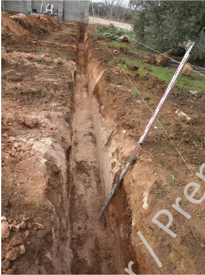
Ilustración 2. Zanja longitudinal de la parcela.

La zanja nos proporciona la sección completa de la parcela en la que podemos observar la tierra vertida para la ocupación agrícola anterior sobre lo que denominamos geológico o base geológica que aflora a cotas muy altas, por lo que los posibles niveles arqueológicos en caso de que los hubiera habido serían escasos. Al ser una secuencia completa del solar podemos destacar que en el solar se encuentran varias vetas distintas de una misma base, en una zona la base geológica presenta una textura más arcillosa y maleable equiparable a la que localizamos en unas parcelas de la misma calle, Baños de Argel 11, 12,13, mientras que aquí encontramos una veta de la misma textura pero la base geológica que nos encontramos es más compacta y sin esa textura plastica aunque igualmente maleable, más arenosa. Por lo que encontramos sobre la misma base geológica algunas zonas con un pregeológico, consiste en una tierra sin material formado por el mismo geológico pero con una menor consistencia.