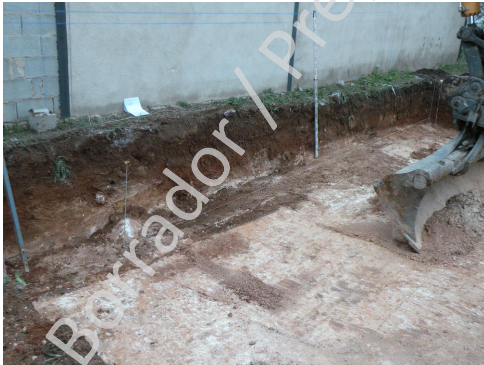
Ilustración 3. Perfil Este de la zona de la piscina.

El resto del control de movimientos de tierra se llevo a cabo en la zona de la piscina, con unas dimensiones de 8 m por 4, bajando unos 80 cm aproximadamente. Se localiza la base geológica en toda la planta. Las unidades documentadas son la U.E 1 en toda la planta, la U.E 3 pregeológico en algunas zonas y la U.E 4 en toda la planta.