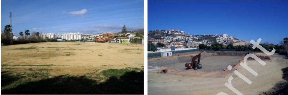
Láms. I-II. Inicio y final de la excavación.

Se encuentra delimitada al norte por el Camino Viejo de Vélez, al sur y oeste por las avenidas de La Concordia y Cotomar respectivamente y al este por el parque infantil Huerta Julián.