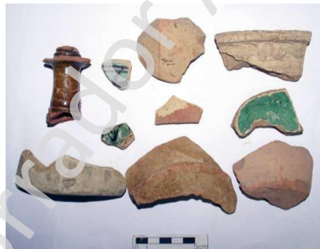
Lám. VIII. Fragmentos cerámicos hispano-musulmanes

Debido a que los fragmentos se encontraban en mal estado de conservación han sido fotografiados “in situ” y devueltos a su lugar de localización.