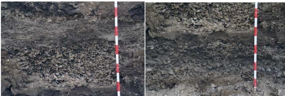
Láms. V-VI. Detalle estratificación torrencial.

A continuación se observa una estratificación torrencial de distintos tipo de espesor formado por varias deposiciones de carácter fluvial y color gris oscuro formadas por arenas gruesas, limos, gravas y cantos angulosos que se alternan con bloques de pizarras, cuarzo y filitas muy deleznales de diverso tamaño.