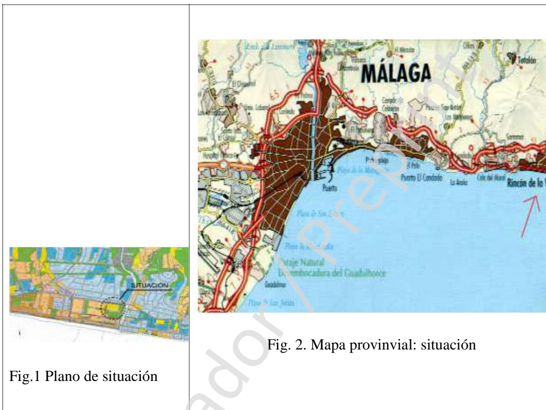
Fig.1 Plano de situación