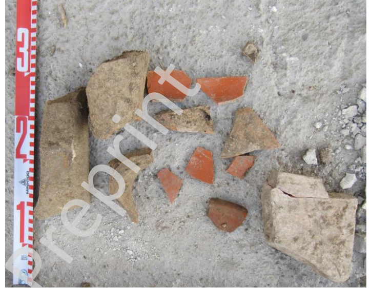
Fig. 2 y 3. Capa tardorromana y materiales asociados.