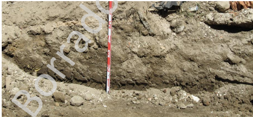
Fig. 1 Perfil del desmonte.

A una cota de de 104'58 m.s.n.m. se registraba el último pavimento en uso del inmueble anterior, bajo él y a una cota absoluta de 104'28 m.s.n.m. se registra la existencia de un pavimento anterior ejecutado con cantos rodados en la zona donde se conservaba que era en la trasera de la parcela. Bajo este último se documentan las cimentaciones y pozos ciegos, infraestructuras relacionadas con el citado inmueble.