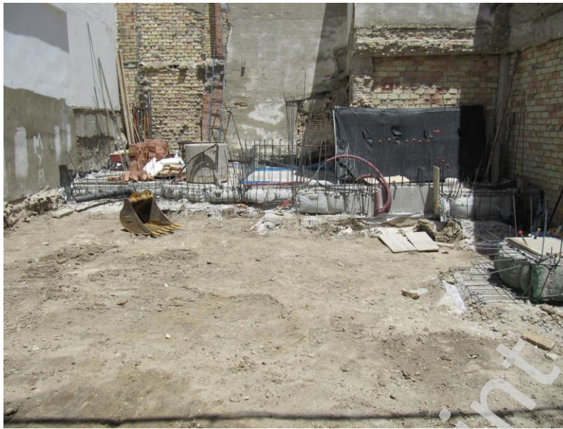
Fig. 4. Vista de la parcela tras la finalización de los trabajos.