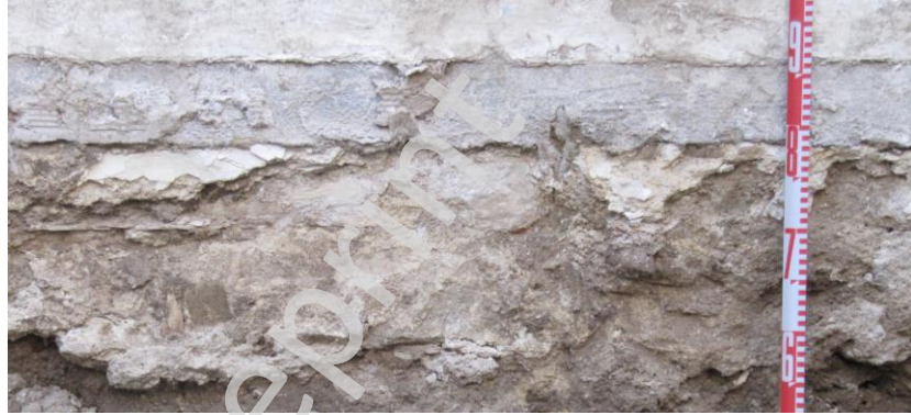
Fig. 1y 2. Superposición niveles de pavimentación