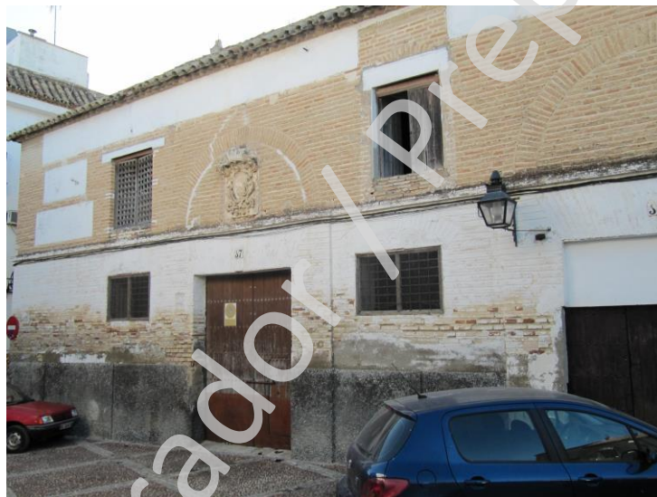
Fig. 4. Edificación contigua. Graneros.