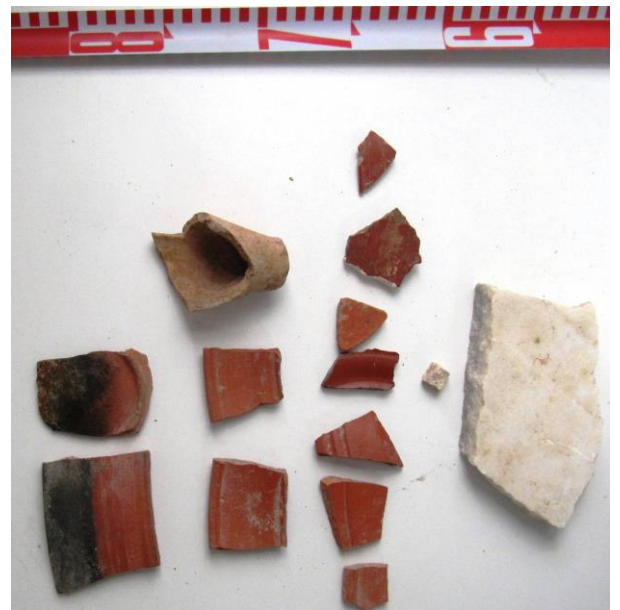
Fig. 6 y 7. Capa y material asociado a la misma.