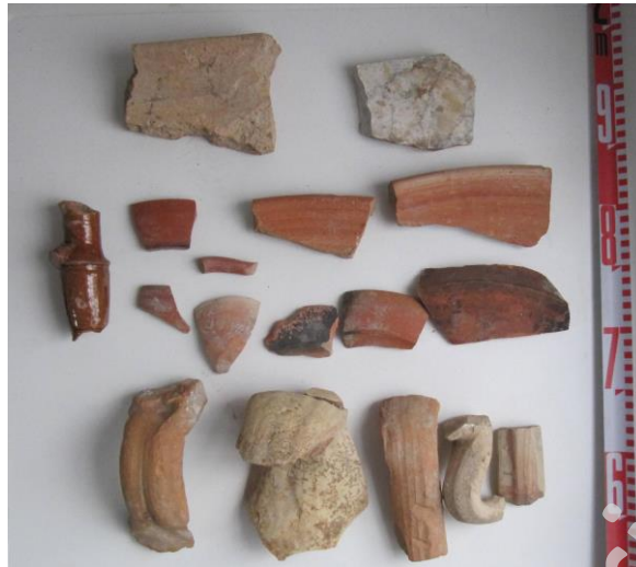
Fig. 5. Material asociado a la capa descrita anteriormente.