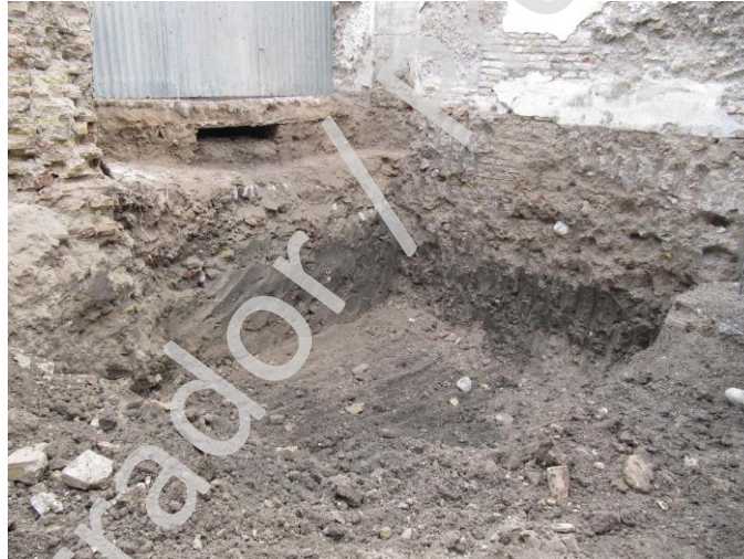
Fig. 3. Vaciado para piscina