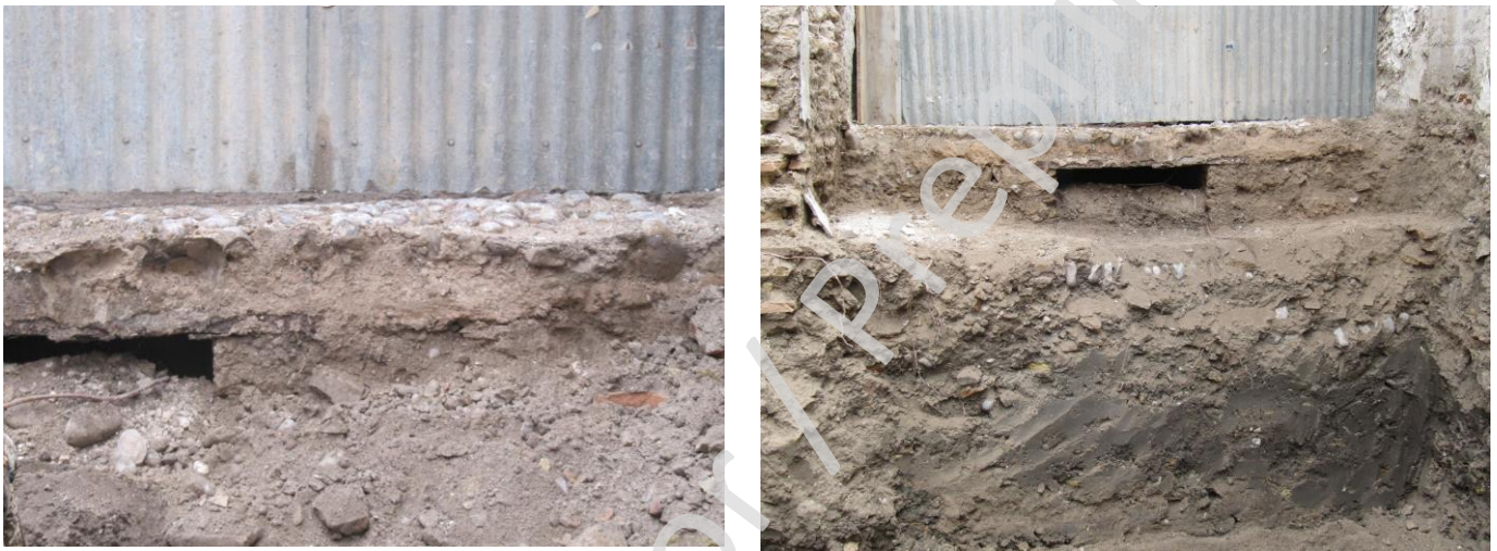
Fig. 1 y 2 Restos de calle empedrada en la trasera

Una vez el solar fue demolido se apreciaba una gran diferencia de cotas entre la trasera de la parcela y la línea de fachada de la misma, una vez que se comienzan los trabajos de limpieza y desmonte, se aprecia que paralela a la medianería trasera (oeste) discurría una calle empedrada 2 , que fue anexionada a la parcela y quedó inserta en zona del patio de la misma.