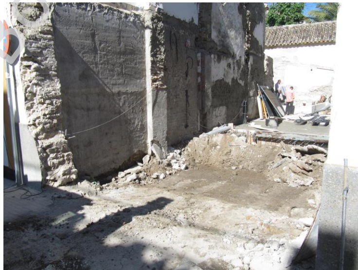
Fig. 4. Vista del solar tras la finalización de los trabajos.