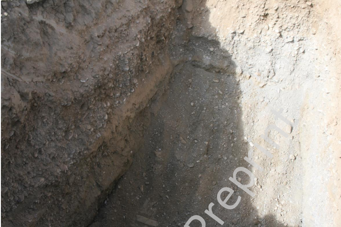
Imagen 01. Sondeo C en su cota máxima de 3.05m

Una vez realizados los sondeos y comprobado la inexistente presencia de material arqueológico, se procede al control de movimientos de tierras, en toda la superficie de la parcela, comprobándose que al igual que sucedió en los sondeos, en el resto de la parcela, no se evidenció la presencia de material arqueológico alguno. Sin registrarse evidencia arqueológica de ninguna clase.