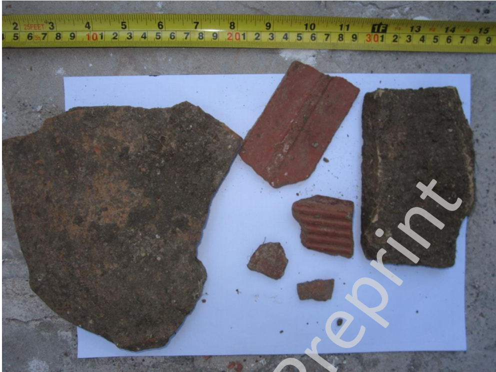
Lam.3 Material asociado a Ue.2