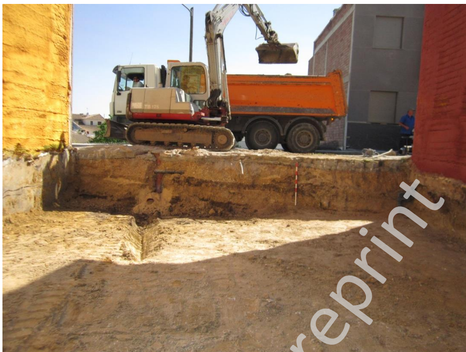
Lam.2 Perfil sur