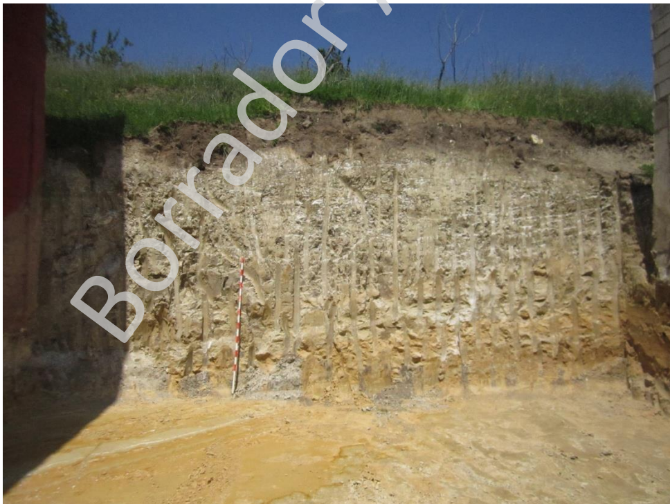
Lam.1 Perfil norte