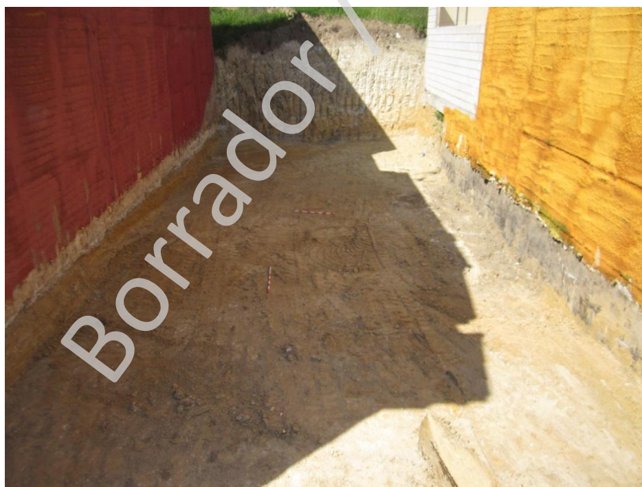
Lam.3 Planta final