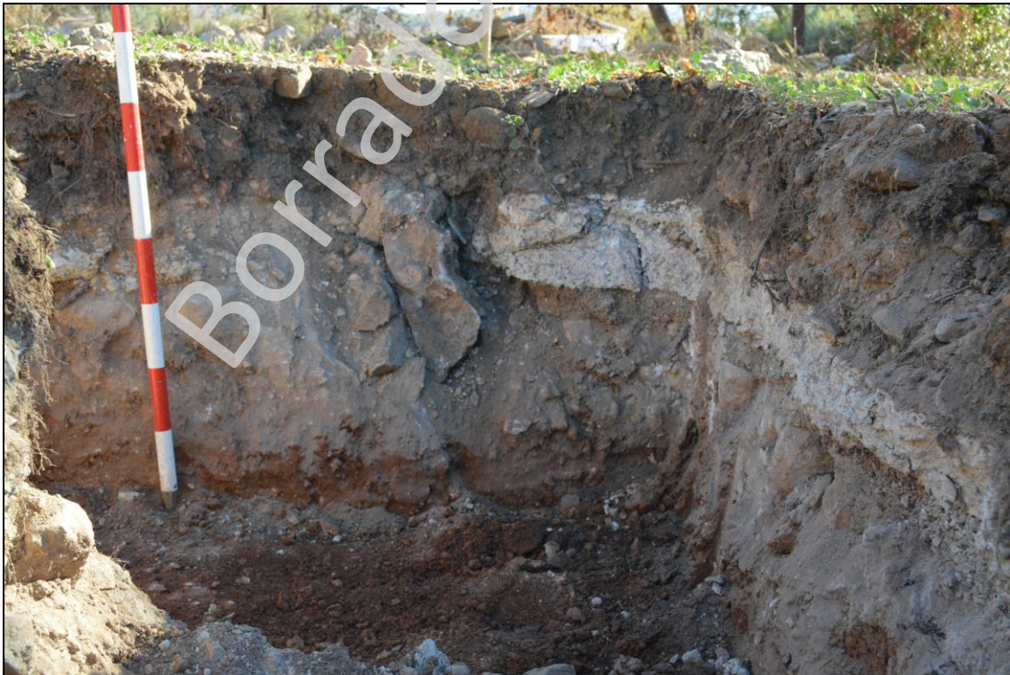
Lám III: Vista del perfil SO