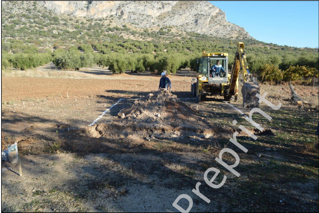
Lám II: Excavación de las zanjas