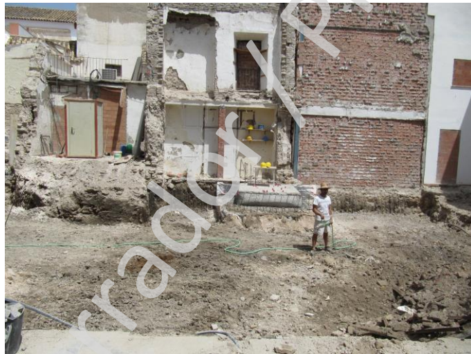
Fig. 1. Vista de la parcela tras la conclusión de los trabajos.

Tras abordar la vigilancia y control arqueológico de toda la superficie de la parcela para la ejecución de la cimentación, las conclusiones no varían con respecto a las expuestas en la memoria preliminar. La incidencia de las obras proyectadas sobre el sustrato arqueológico ha sido totalmente nula. El desmonte de tierras efectuado ha afectado solamente a niveles estratigráficos de cronología contemporánea del s. XX.