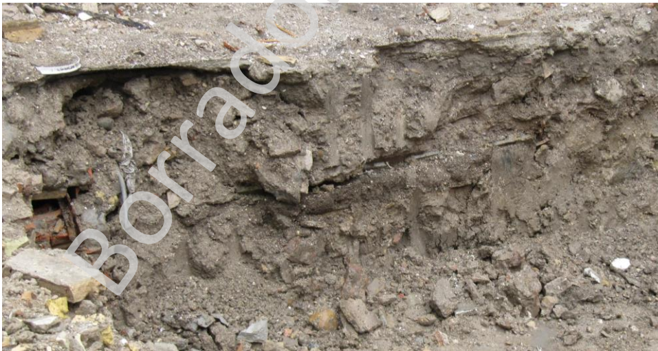
Fig. 7 y 8. Restos de pozos ciegos y capas de vertidos.