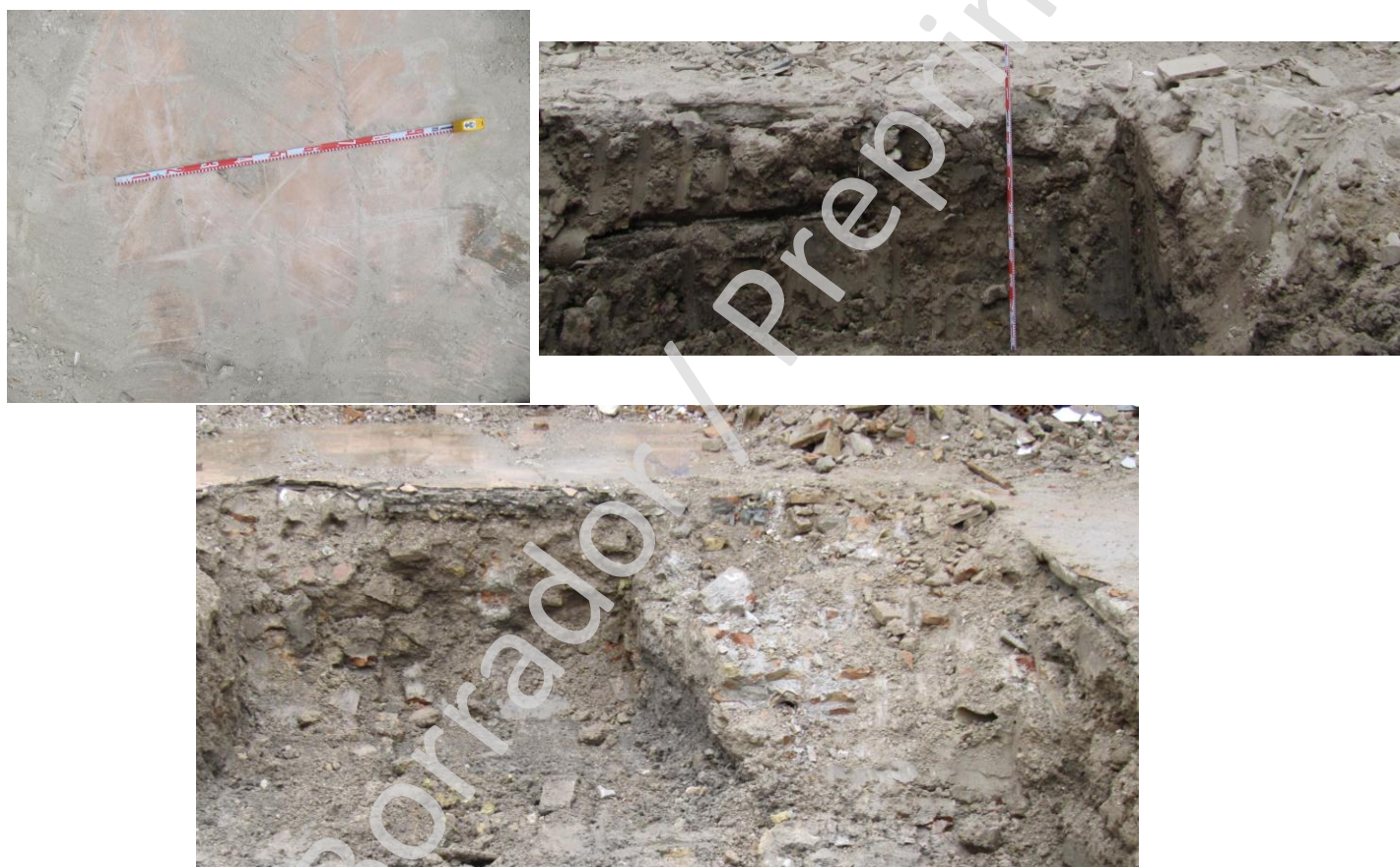
Fig. 2, 3 y 4. Estratigrafía relacionada con el último uso del inmueble. Finales del S. XX.