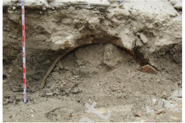
Fig. 5 y 6. Restos de tinajas de almacenamiento de grano.