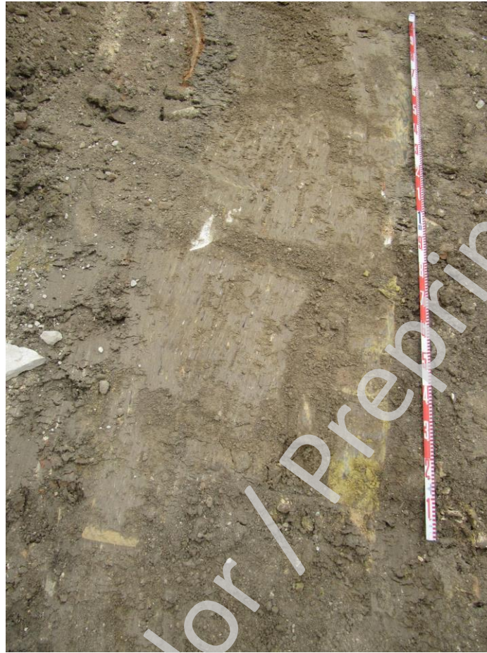
Fig. 9. Restos de muro bajomedieval a cota de replanteo de cimentación

hipótesis. El muro se encuentra muy mal conservado debido a la incidencia de las estructuras e infraestructuras posteriores.