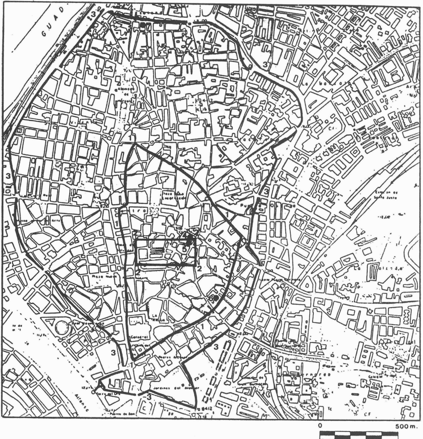
FIG. 1. Plano de Sevilla con indicación de: 1.- Muralla imperial romana. 2.- Foro imperial. 3.- Cerca medieval. 4.- c/ Allhóndiga, nº 24. 5.- c/ Boteros, nº 27. 6.- c/ Céspedes, nº 9. 7.- c/ Bécquer, nº 37.

En esa fecha el Museo Arqueológico Provincial de Sevilla emprendió un plan de actuación de urgencia que permitió comenzar a solucionar las carencias de la investigación arqueológica de la