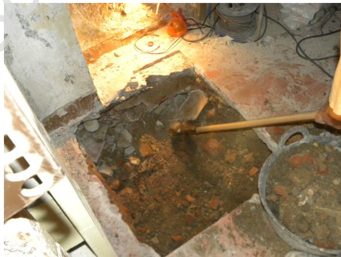
FIGURA 02: PROCESO DE EXCAVACIÓN DE LA ARQUETA EN PLANTA BAJA