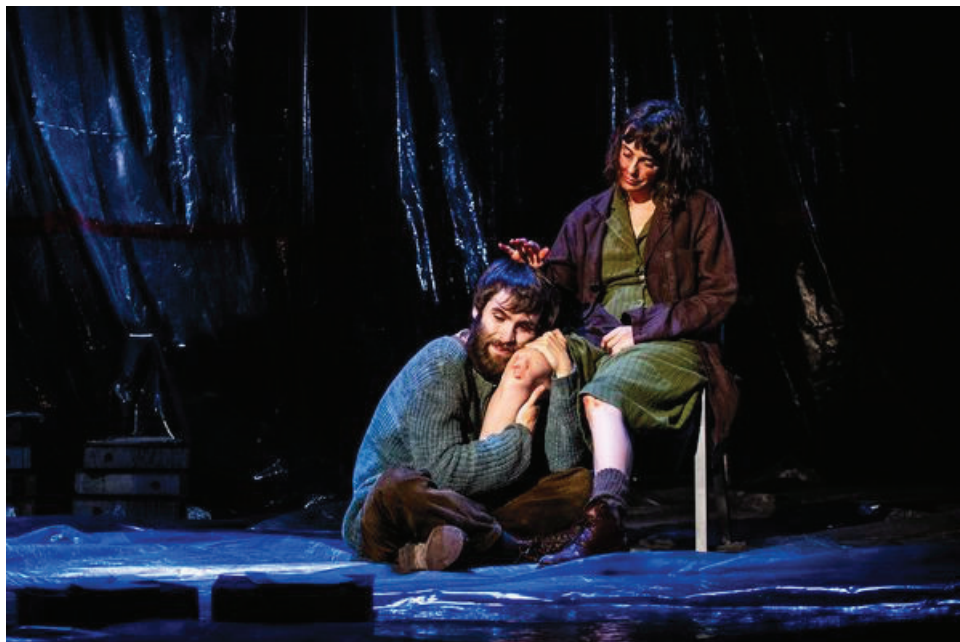
Ricardo Gómez y Belén Cuesta forman la mitad del elenco de "El hombre almohada"

Por estas cosas del azar, el teatro Lope de Vega acogió durante dos fines de semana consecutivos sendas obras de teatro cuyo reparto estaba encabezado por una figura del cine andaluz, Antonio de la Torre (en Un hombre de paso) y Belén Cuesta (en El hombre almohada). Curiosamente, los dos protagonizaron La trinchera infinita, por la que fueron nominados al Goya aunque finalmente solo ella se alzara con el galardón hace dos años. Poseedores de una reconocida trayectoria en cine, ambos han decidido apostar por subirse al escenario como muestra de su compromiso y amor por el arte de Talía.