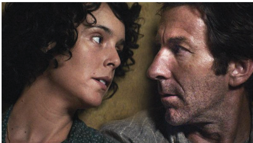
Belén Cuesta y Antonio de la Torre protagonizan "La trinchera infinita"

Por estas cosas del azar, el teatro Lope de Vega acogió durante dos fines de semana consecutivos sendas obras de teatro cuyo reparto estaba encabezado por una figura del cine andaluz, Antonio de la Torre (en Un hombre de paso) y Belén Cuesta (en El hombre almohada). Curiosamente, los dos protagonizaron La trinchera infinita, por la que fueron nominados al Goya aunque finalmente solo ella se alzara con el galardón hace dos años. Poseedores de una reconocida trayectoria en cine, ambos han decidido apostar por subirse al escenario como muestra de su compromiso y amor por el arte de Talía.